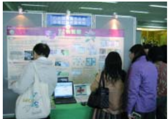
行政院農業委員會林業試驗所圖書館以「珍貴植物圖譜」為主題，參加97年專門圖書館海報展。(97.12.6)

該館館藏最具代表性之圖書為上百冊的植物圖譜，不但年代久遠，更兼具物種多樣性、歷史稀有性、學術研究性及藝術價值性等多重意義，內容包括有中國、日本、西班牙、錫蘭、中南美洲及澳洲等各地的植物圖繪；年代涵蓋期間自1770年至1921年，其中多部為全臺唯一完整珍藏，如《本草圖譜》、《北海道主要樹木圖譜》、《Monographie des melastomacees》等。96年起執行國科會「日治時期林業文獻典藏數位計畫」，將該館特藏之植物圖譜、期刊及圖書進行數位化，至97年底已完成13部圖譜數位化作業，並建置資料庫以為長期之保存，同時提供社會大眾線上瀏覽。此外，97年7月起又透過國科會「植物圖譜加值應用計畫」之產學合作計畫，提升植物圖譜在現代文化創意產業加值的應用層面與經濟效益。同年該館以珍貴植物圖譜參與中華民國圖書館學會年會海報展，透過人員解說及海報展示，成功的推展了林業研究文獻的意義與價值。(鄭美如)