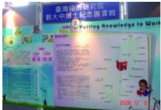
劉大中博士紀念圖書館以「Putting Knowledge to Work」為題參加97年專門圖書館海報展(97.12.6)

(一) 介紹母機構與本館歷史。臺灣經濟研究院為臺灣最早設立之民間獨立學術研究機構，從事國內、外經濟相關之研究，並積極推展國際事務；(二) 以圖表比較館務運作上外界常有的誤解並釐清迷思。專門圖書館的經費多不甚寬裕，該館受院方完全的支持，館藏品質以精實為重。在採購新進資源的效率上更要求快速確實，館藏亦實施汰換機制以保持館藏整體的高實用性；(三) 介紹館藏特色。該館累積30餘年經濟研究資源，包含統計資料、研究報告、國際組織或著名出版社的出版品。(四) 以星狀圖連結特藏間的關係，延伸服務。該館服務院內同仁完成各項研究專案，所累積之研究成果得供更多需求者使用；最後以「服務因需求而有價」做為總結。(黃喬玲)