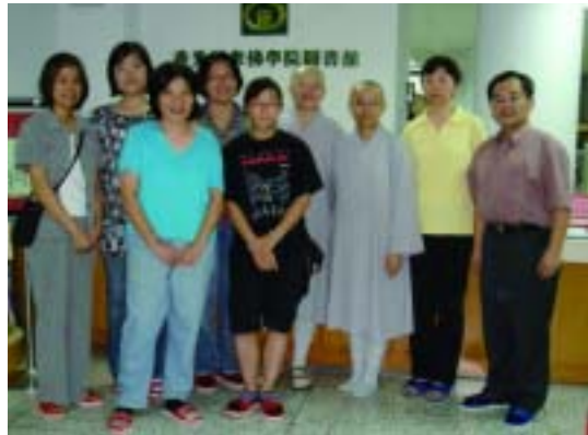
中華民國圖書館學會專門圖書館委員會一行參訪香光尼眾佛學院圖書館 (97.6.14)

該委員會97年度第1次參訪活動為97年6月14日至15日前往嘉義縣竹崎鄉內埔村參訪香光尼眾佛學院圖書館，總計有國家圖書館、力晶半導體資料中心、資策會資訊市場情報中心等單位之委員及單位同仁參加，了解香光尼眾佛學院圖書館之資源與服務。