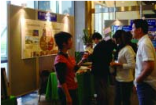
國立臺灣歷史博物館圖書室以「讓你找到自己的歷史——蘊藏臺灣人故事的圖書館」為主題，參加97年專門圖書館海報展。(97.12.6)

國立臺灣歷史博物館圖書室於96年10月20日正式揭牌營運，為支援博物館研究、典藏、展示及教育等各方發展，於籌備處期間即致力廣泛蒐集館內研究人員所需各類型資料，尤其是臺灣史發展軌跡相關之資源，期能發揮臺灣史文化之蒐藏、研究、教育及交流之功能，進而達成臺史博成為臺灣史學研究中心之使命。館藏類型包含圖書、視聽資料、微縮資料、期刊、地圖及資料庫等，至97年底計有圖書19,446冊，學位論文297冊，期刊157種，地圖892幅，善書27,002件，視聽資料約1,000種，線上資料庫20種，微縮影資料1,500件。服務對象以臺灣歷史博物館館內員工為主，並開放給館外研究學者及一般民眾入館閱覽。