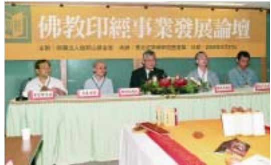
「佛教印經事業發展論壇」第一場論壇「佛教印經事業發展回顧」(97.9.27)