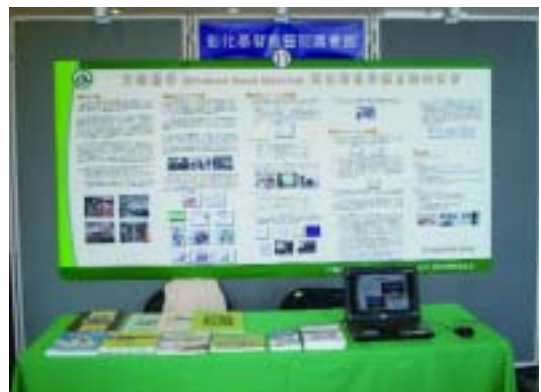
彰化基督教醫院圖書館參加97年專門圖書館海報展，發表主題為「實證醫學對臺灣醫學圖書館的影響」。（97.12.6）