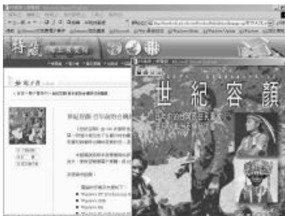
「世紀容顏電子書」的下載網頁

電子書自由跳頁點選的便利功能，具有忠實呈現原書版面、3D立體翻頁效果，或可依據需求製作聲音、動畫以及具備畫線、註記等功能。兩種閱讀軟體雖然在表現形式上類似，閱讀效果與圖像放大品質也均佳；但兩者最大的不同在於zinio採用下載後離線閱讀的方式閱讀，flip則主要採取線上瀏覽資料。