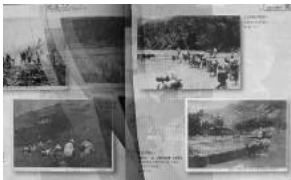
「世紀容顏電子書」的3D翻頁效果

《世紀容顏.zno》的讀者，透過系統核發的e-mail通知，即可自行點選下載檔案。只要下載完成，就可以在電腦上閱覽該書，並可合法獲得該書的永久擁有權。其保護機制為：系統按讀者申請下載的e-mail address核發專屬於讀者個人的zinio reader（不需付費），並藉由現代科技數位版權管理DRM（Digital Right Management）的幫助，以確保