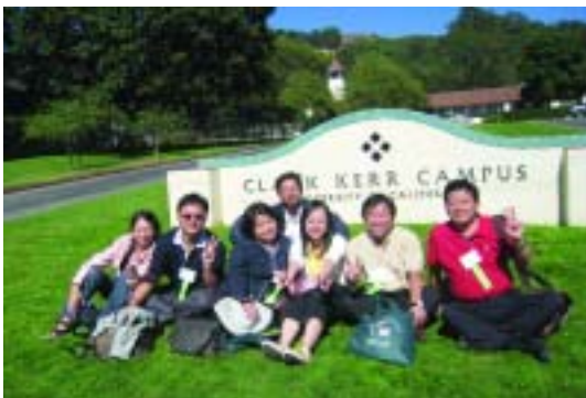
IASL 2008年會於美國加州柏克萊大學 Clark Kerr Campus 舉行, 臺灣代表團成員於校門合影。(97.8.3)