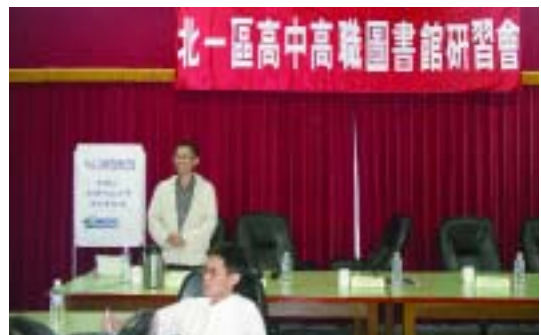
於臺北市立華江高級中學舉辦「Web 2.0時代的圖書館」演講活動，邀請朝陽科技大學洪朝貴教授主講。(97.5.22)

(二) 97年9月25日於臺北市立華江高中舉辦「讀者參與的高中圖書館服務——Library 2.0的實踐」演講活動，由輔仁大學毛慶禎教授主講，毛教授提出實務性的看法及做法，指出圖書館2.0存在於圖書館界多年，現在更有機會實現它。