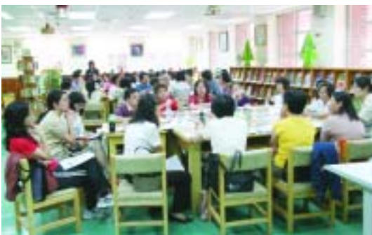
「臺北市國中圖書館業務人員研習」於臺北市建成國中舉辦，分組討論時各校分享「新生導覽」之做法。(97.11.6)

97年11月6日辦理年度館員研習。由五常及西湖國中館員主講「讓圖書館增色」：館訊製作及館內佈置。另分組進行「新生導航」，由輔導員帶領館員們分享各校新生導覽之作法，從中激盪出更好的點子，以利未來工作之推動。