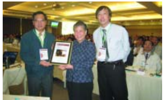
國立中央大學神經科學研究所所長洪蘭教授演講後，承辦單位以洪教授講演之活動照，當天製作感謝狀致贈洪蘭教授（中），感謝其對本次會議的熱情支持。（97.11.12）

工作報告則包括：高中職圖書館輔導團工作報告、中學生網站介紹、臺灣學校圖書館館員學會報告等。