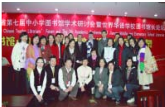
出席「世界華語學校圖書館館長論壇」之臺、港、澳、馬成員於會場合影。(97.12.27)