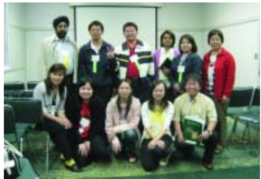
臺灣代表團成員於東亞區會議後合影留念。

該次年會從8月4日開始至8月7日閉幕止, 共舉辦了4場Keynote演講會、72場研討會及工作坊、5場討論會、1場說故事表演、1場詩歌朗誦、7篇海報展覽, 臺灣共計發表10篇論文, 其中高中職5篇、國立臺灣師範大學2篇、國立中興大學2篇、國立臺灣大學1篇; 最後一天由美國欣欣教育基金會趙耀渝董事長利用午餐時間做了一場演講, 介紹中國大陸中小學圖書館經營狀況, 反應熱烈十分成功, 目前該基金會擁有數百萬美元的實力, 正在中國推廣圖書館自動化系統