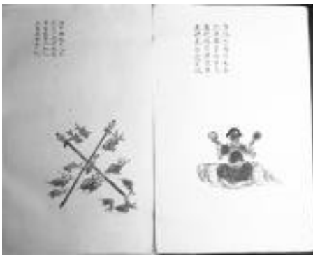
圖版二：高延本第一、二圖

虎戰龍爭百事悲 萬代興亡難盡計 且以武后定玄微 第 2 圖 江中鯉魚十八子 片片只從流水起 子子孫孫八九人 三百年中少一紀 第 3 圖 擬將社稷亂分墮 爭奈天公十八枝 賴得忠良火邊犬 方能策立舊唐基 第 4 圖 鑾鈴擊鼓過潼關 此日君王帶纓山 木易若逢山下鬼 定於此處送君還