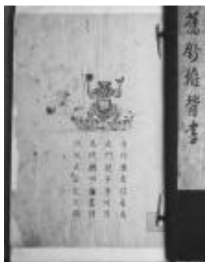
圖版五：高羅佩本函套及第一圖

內容：第 1 圖 自從盤古得希夷 虎門龍爭事可悲 萬代興亡難盡計 且從武后定 文 微