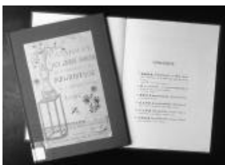
圖版四：薛力赫編《漢學院中文圖書目路》

著錄書目：該書著錄於薛力赫教授 [8] 1886 年編的 Suppliment au Catalogue Des Livres Chinois qui se trouvent dans la Bibliotheque de L'universite de Leide 第 10 頁 137b [9] (附圖版四)