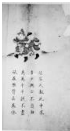
圖版六：高羅佩本第 66 圖

解說：全帙以棉紙繕寫，每半葉一圖，附七言詩一首，不記頁碼。圖以工筆彩色畫成，色彩鮮麗明艷。（圖版五、六）上圖下詩。