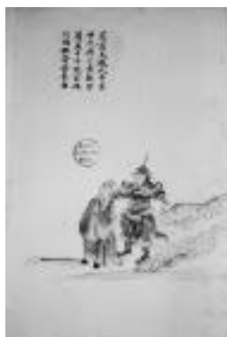
圖版三：高延本第 65 圖

第 65 圖 茫茫天數此中求 世代興亡盡觀留 萬萬千千說不休 只因推背去來由 (圖版三)