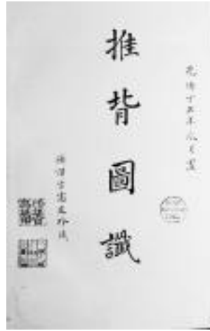
圖版一：高延本扉頁

扉頁題：扉頁中間大字題「推背圖識」，右上小字題「光緒丁丑年瓜月置」，左下小字題「繙譯官高延珍藏」及「繙譯官高延印」陽文朱方印、「高延瑯行二」陰文朱方印。（圖版一）