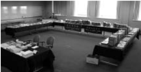
甫布置就緒的書展會場全貌

議品質的用心。由於籌備委員分散北美、臺灣乃至歐洲等地，且經費有限，所以會議的籌辦多仰賴國際網路（Internet），NATSA 有自己的網站（ http://www.na-tsa.org ），從公布年會主題和各項訊息（包括會議時程、當地交通食宿狀況、如何洽訂旅館等），公開徵求論文（call for papers），論文繳交等，都透過網路公告傳輸。會議手冊中僅印出各篇論文的摘要，論文全文則放在 1 片光碟中，供線上閱讀。甚至在研討會進行時，有些論文發表人未克赴美出席，則利用 Skype 等連線越洋宣讀，可見年輕人更懂得掌握資訊社會網路科技的特質和優勢，這是值得我們日後籌辦國際研討會參考學習的。我覺得這個學術組織給予青年學者很好的學術訓練，而且該學會歷經十幾年的經營，已愈來愈受到國際上從事臺灣研究學者的注目。