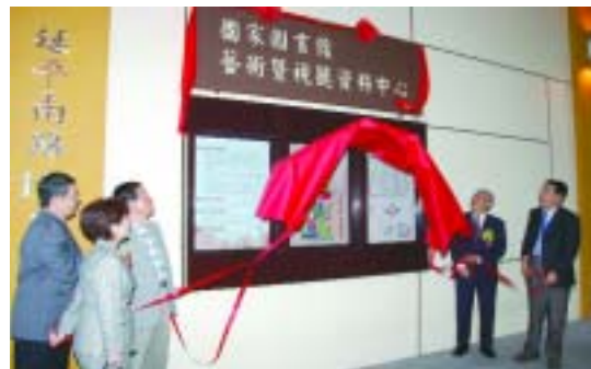
國家圖書館藝術暨視聽資料中心由教育部鄭瑞城部長（右二）主持揭牌典禮後正式開幕啓用（97.10.27）

為散播美學生活素養的種子，及提供藝術相關領域人士一處汲取廣博知識學問的殿堂，國圖規劃之「藝術暨視聽資料中心」於97年10月27日在教育部鄭瑞城部長主持揭牌典禮後，正式開幕啓用。