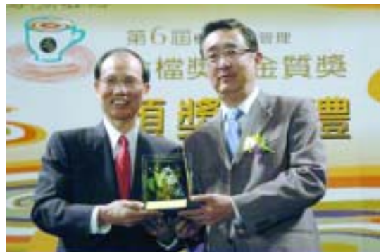
國家圖書館榮獲行政院第6屆機關檔案管理金檔獎，行政院薛香川秘書長（左）代表劉兆玄院長頒發獎座及獎狀，顧敏館長代表領獎。（97.10.2）

表領獎；教育部鄭瑞城部長於10月30日部務會議中親自嘉勉，並頒發新臺幣100萬元獎勵金。