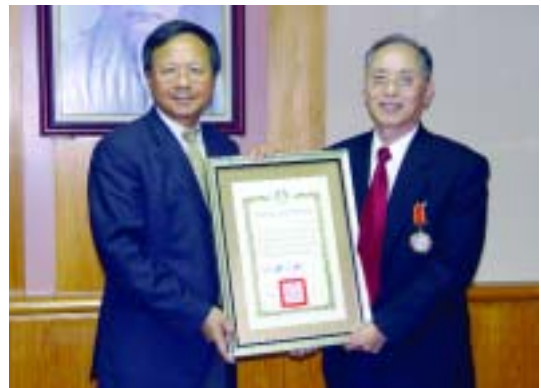
國家圖書館黃寬重前館長榮獲教育部杜正勝部長頒發三等教育文化專業獎章（97.5.7）