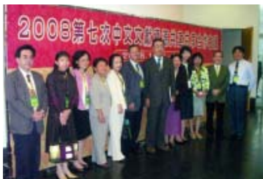
出席「第7次中文文獻資源共建共享合作會議」臺灣代表團合影（97.11.8）

會後參訪澳門中央圖書館總館及其兩所分館（何東圖書館、民政總署大樓圖書館）、澳門歷史檔案館以及市區內的八角亭圖書館。