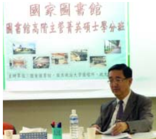
國家圖書館顧敏館長於「圖書館高階主管菁英碩士學分班」講授「傑出領袖講座」課程。(97.11.1)

為培育圖書館與資訊機構之高階管理人才，97年11月至98年1月間與國立政治大學公共行政及企業管理教育中心合辦「圖書館高階主管菁英碩士學分班」，以培育圖書館領導人員具備圖書館創新服務新思維為課程宗旨與目標，第1期課程以「圖書館創新與領導」為規劃主軸；講師陣容包括顧敏館長、政大圖檔所王梅玲所長、楊美華教授、薛理桂教授、蔡明月教授、資管系李昌雄副教授、哲學系劉若韶教授、廣告系游本寬主任、企管系洪順慶教授、資策會資料服務中心黃麗虹主任、金融系廖四郎主任、教育系井敏珠副教授、臺灣師範大學圖書館陳昭珍館長、臺北市立圖書館曾淑賢館長、淡江大學圖書館黃鴻珠館長等講座；課程內容豐富多元，分別為傑出領袖講座、創新與創造力、創新管理、邏輯思維、領導與激勵、財務管理、人際關係與壓力管理、美學與設計、策略規劃、會議策展與國際交流、評鑑與績效管理、從心服務的行銷策略、管理實務個案討論等。計招收學員25人。