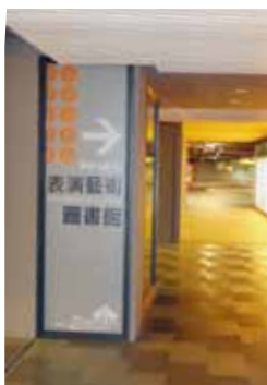
國立中正文化中心表演藝術圖書館指標更新 (100.7)

一、本館於100年7月完成入口意象更新案，將入口的指標最做得更清楚，並在門口新增表演藝術圖書館創辦至100年大事記。