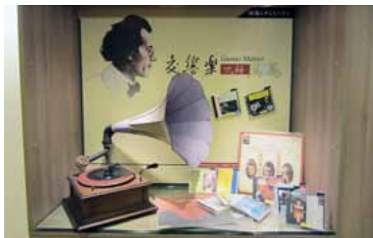
交響樂大師——馬勒館藏主題展（100.7.15）