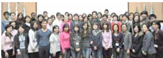
圖書資訊專業國際交流與合作國際研討會全體與會人員大合照 (100.12.2)