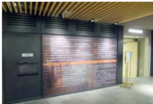
國立中正文化中心表演藝術圖書館入口意象之牆面展示該館大事記 (100.7)