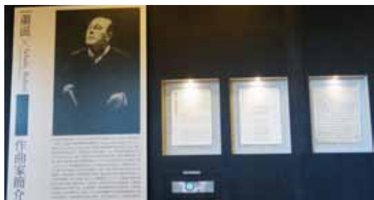
作曲家蕭滋樂譜手稿展（100.8.2）