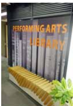
國立中正文化中心表演藝術圖書館入口意象更新 (100.7)