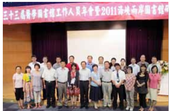
醫學圖書館委員會委員於第33屆醫學圖書館工作人員研討會與CALIS代表團成員合影（100.8.26）