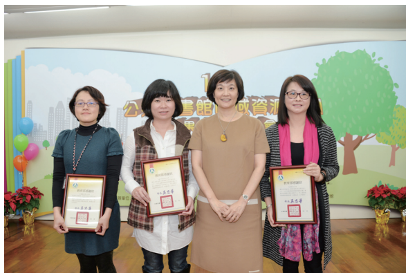
教育部林思伶政務次長(右二)致贈感謝狀予獲「優質空間獎」之宜蘭分區資源中心(左一)、中區資源中心(左二)及東區資源中心(右一)與會代表

個資源中心願意投注人力、擔負責任，透過資源中心的建置，散播知識能量，讓臺灣社會更富語文力、創造力與競爭力。記者會上並公布資源中心中文圖書、西文圖書、東南亞語文圖書、視聽資料、電子書借閱排行榜，展示藉由本計畫的執行，各資源中心因有大量而豐富優質館藏的掖助，對提昇全民閱讀質量的具體成效。同時藉由各大媒體對本計畫成果豐碩之報導，擴增更多閱讀群眾利用資源中心館藏資源，增進閱讀興趣及提升國民之競爭力。