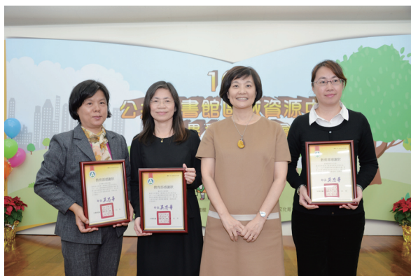
教育部林思伶政務次長(右二)致贈感謝狀予獲「資源投入獎」之苗栗分區資源中心(左一)、臺南分區資源中心(左二)及澎湖分區資源中心(右一)與會代表