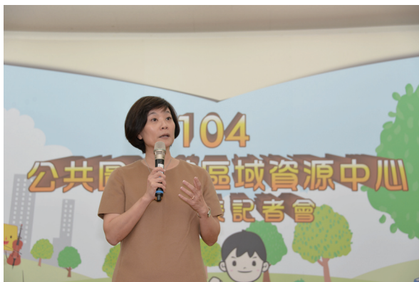
教育部林思伶政務次長致詞

教育部林思伶次長在致詞中肯定國圖計畫執行成果，並期待各資源中心在優質館藏的基礎上，努力推廣閱讀，讓閱讀成為全民習慣。會中由林思伶次長致贈感謝狀予12個分別在空間營造(含自明性、設置地點、空間設計、結合資源中心及地方特色)、資源投入(機關、首長重視程度、社會資源投入程度、資源運用)、閱讀推廣(借閱量、通閱量高、活動辦理切合主題特色、行銷推廣)等方面各具營運特色的資源中心，並且提供資源中心或公共圖書館作為業務經驗交流與相互學習參考的對象。