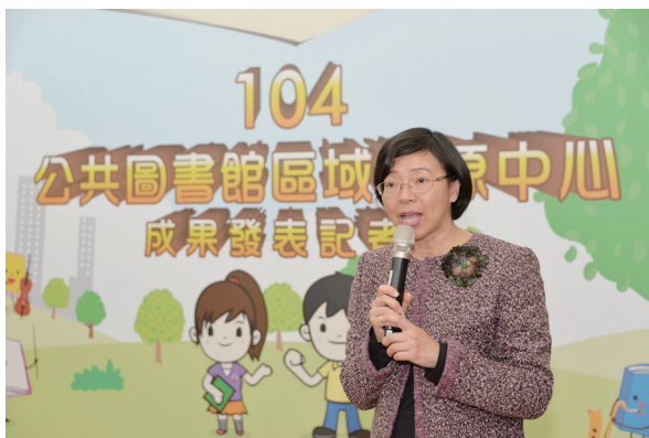
國家圖書館曾淑賢館長致詞及簡報

教育部林思伶次長在致詞中肯定國圖計畫執行成果，並期待各資源中心在優質館藏的基礎上，努力推廣閱讀，讓閱讀成為全民習慣。會中由林思伶次長致贈感謝狀予12個分別在空間營造(含自明性、設置地點、空間設計、結合資源中心及地方特色)、資源投入(機關、首長重視程度、社會資源投入程度、資源運用)、閱讀推廣(借閱量、通閱量高、活動辦理切合主題特色、行銷推廣)等方面各具營運特色的資源中心，並且提供資源中心或公共圖書館作為業務經驗交流與相互學習參考的對象。