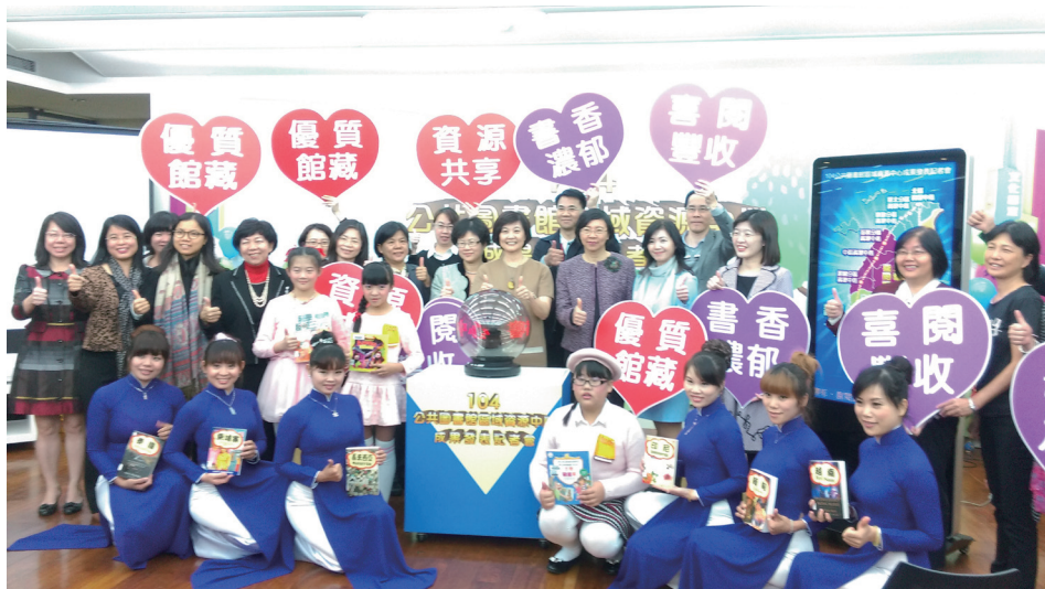
成果發表記者會與會貴賓合影