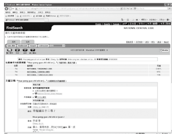
圖二、書目於授權網域OCLC World Cat FirstSearch查詢樣例