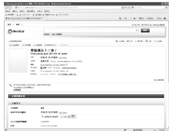
圖一、書目於一般使用者介面OCLC WorldCat.org查詢樣例

專案助理在書目批次上傳成功之後，會收到OCLC回傳之報表，依據報表所列書目問題，人工檢視無法上傳之書目問題。依據問題性質進行書目資料修正，101年人工修正處理之紀錄共1萬餘筆。為了後續前置書目處理的方便，亦同時調校整合上傳機制之檢核規則，並隨時與OCLC人員進行資料問題聯繫。除了蒐集資料處理及上傳過程發現的書目問題之外，另定期檢視各項作業流程及資料上傳結果，以作為後續計畫執行流程調整之參考依據。