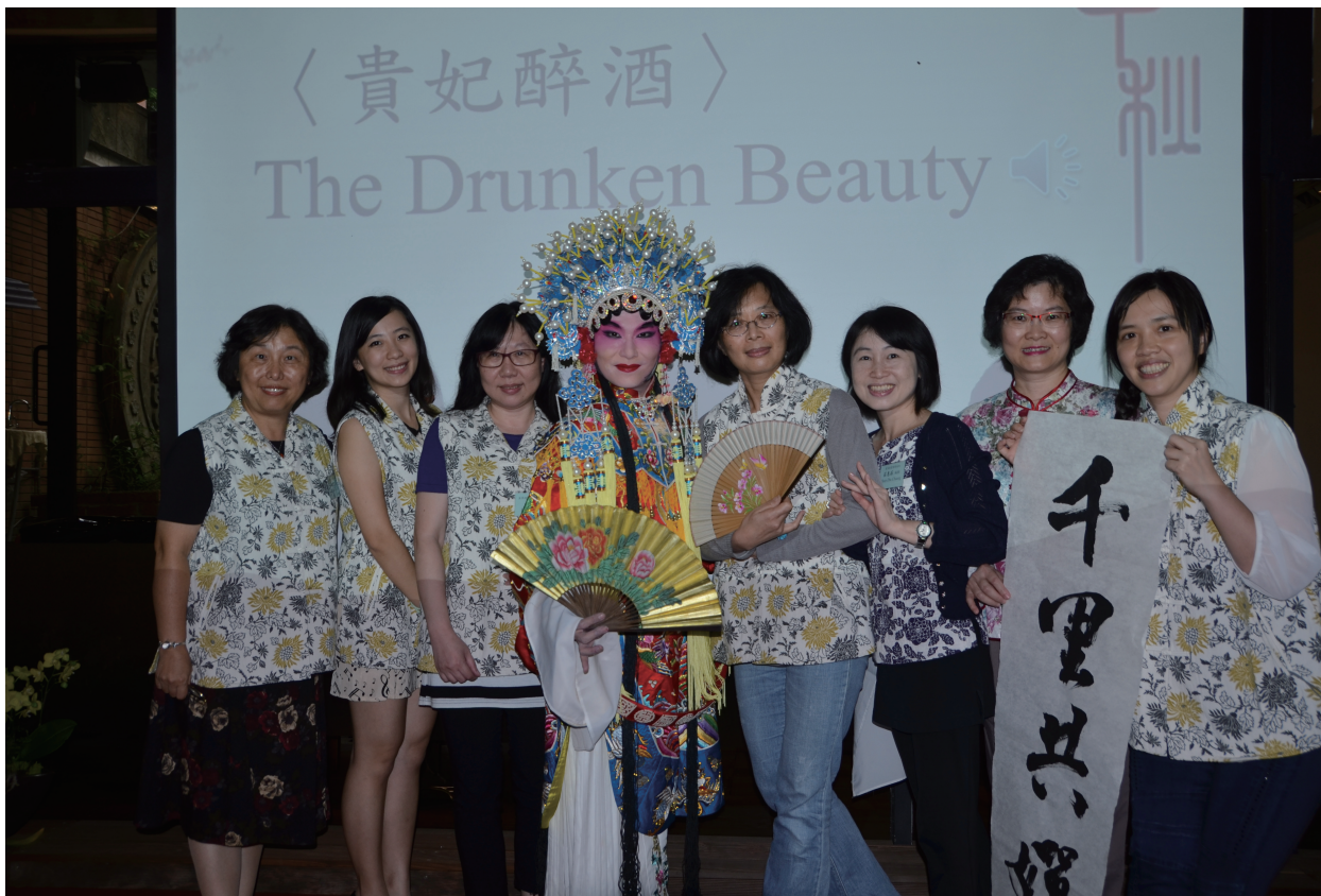
與會表演人員與工作人員合影