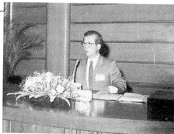
健全圖書館事業， 發揮社會教育功能

總之，圖書館事業是一項教育與文化事業，圖書館工作是一項社會服務，個人謹藉此機會對全省一萬一千位圖書館工作同仁，對他們的終年辛勞，站在服務的第一線上默默耕耘，致以最高的敬意，並祝諸位先生女士身體健康，精神愉快，會議成功。