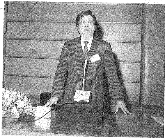
進步中的臺灣省公共圖書館事業

總之，今後我國圖書館事業的推展，首應從速擬定具有時代精神，更配合實際需要的圖書館法與標準；再健全圖書館組織，以期事權統一，負責策劃推展，以收實效；同時，加速培養專門人才，有效推動工作，發揮效能，才能收到良好的效果。尤其是，今後我國圖書館事業的規劃與推動，宜有一專責機構，為圖書館的長遠與整體發展謀求合理妥善的規劃，以加速推動圖書館事業，充分發揮圖書館的社教功能，來促成社會的進步與國家的現代化。