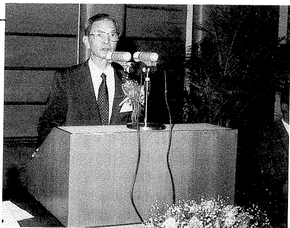
教育部施次長金池 致詞

今天是「全國圖書館會議」開幕典禮，謹代表教育部，向來自全國各地的圖書館代表與貴賓表示誠摯的歡迎與感謝。