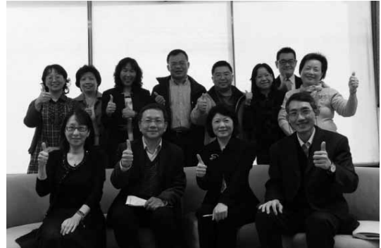
102年2月22日八芝連組織第1次館長座談會議，與會館長及同道合影。