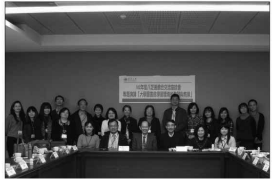
102年12月5日實務交流座談會，與會成員於銘傳大學桃園校區圖書館會場合影。