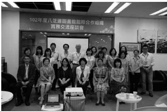
102年7月18日實務交流座談會，與會成員於東吳大學圖書館座談會會場合影。