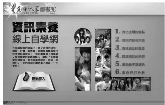
逢甲大學圖書館99年推出之「資訊素養線上自學網」