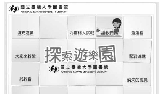
臺大圖書館於100年推出之線上遊戲