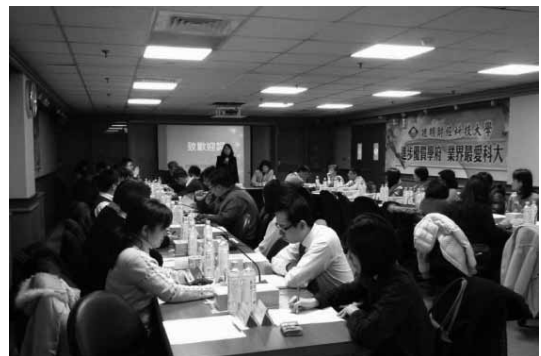
102年12月27日於德明財經科技大學圖書館舉辦之「微利時代中文繁體電子書雲端服務的挑戰與機會圓桌座談：圖書館與業界的對話」

談，讓圖書館、平臺廠商及出版業能以更貼近讀者需要的角度，討論及思考中文繁體電子書的未來，共創多贏結果。