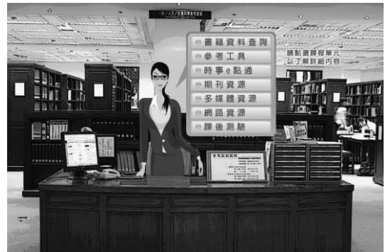
臺大圖書館「圖書館探索之旅」以活潑圖像吸引學習

12所大專校院圖書館共同參與題庫的編寫，完成「大學生資訊素養線上評量網」自評平臺（ http://il.cttlrc.fcu.edu.tw/information-literacy-test/?lang=en ）的初步建置工作，期待未來該平臺完成後能提