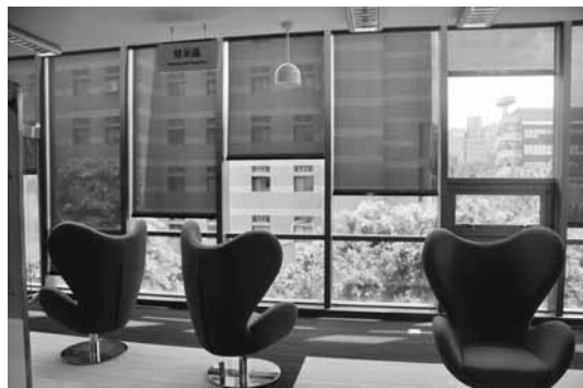
國立清華大學圖書館館舍空間