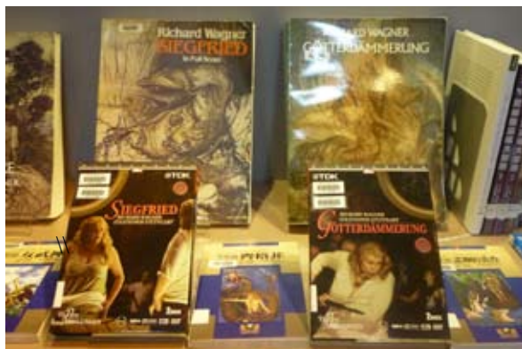
西洋愛情展部份展品之二