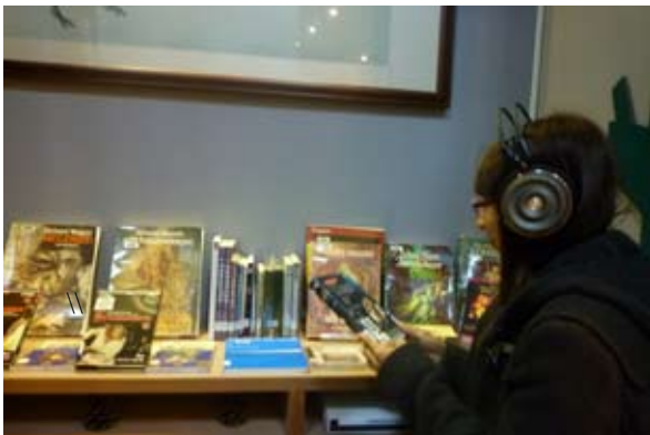
西洋愛情展讀者聆賞音樂