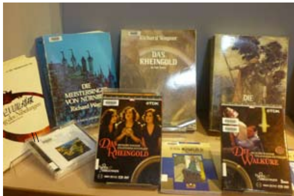
西洋愛情展部份展品之一

今（105）年1月至3月，則由第四檔「愛情啊！玫瑰騎士」，為「愛情啊！」系列畫下句點。《玫瑰騎士》是二位大師合作的作品，作曲為理查·史特勞斯，劇本作者為霍夫曼史塔，劇中不僅展現幽默、對愛情的憧憬，也是集人性的高貴與卑劣於一身的三幕歌劇，敘述貴族們戀愛的輕鬆作品，它同時也是上流社會的縮影，其龐大的管弦樂，規模足以比擬華格納後期作品，劇名《玫瑰騎士》是維也納貴族向女方提婚約時，需要派一個使者送銀製玫瑰作為訂約的證物，派去的使者稱為玫瑰騎士，但當時並沒有這種習俗，其實是霍夫曼史塔的創作。