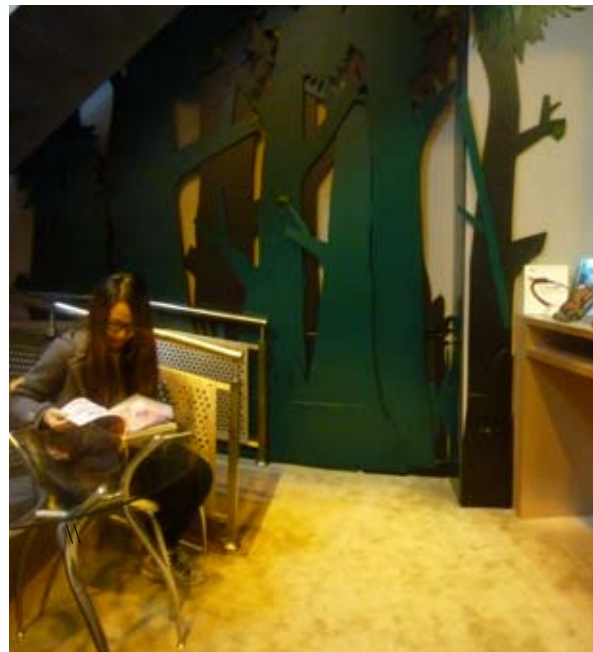
一個人獨享的閱讀時光