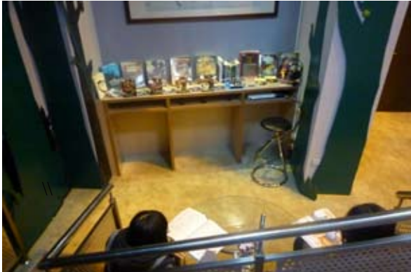
西洋愛情展閱讀角落