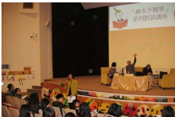
館長代表主辦單位及全場302位聽眾感謝兩位大師長期投入繪本創作之努力