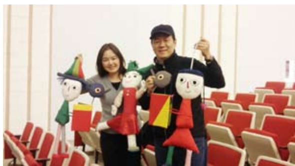
閱讀大軍義賣活動獲得讀者熱烈參與

本館閱讀大軍義賣活動接著於座談會結束時舉行，得到眾多熱情人士支持與肯定，本館同精心製作的布偶悉數拍賣出去，6件珍珠板大軍也搶購一空，我們並將今天愛心人士認購的款項全部捐助偏鄉地區之公共圖書館／學校圖書館購