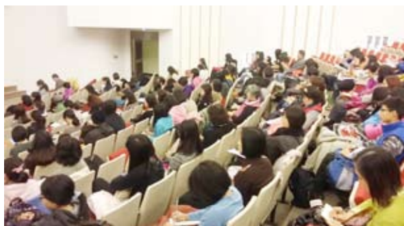
讀者踴躍參與座無虛席

由於兩位對談人皆體認到圖畫書揉合藝術、哲學、文學等面向之優點，而她們也從美及日本的生活環境中領悟到讀書會是閱讀紮根的力量，因此長期致力於讀書會之經營。三位老師在對談過程中共同強調大量閱讀之重要性，讀書會之功能即在引導愈來愈多的家長及兒童，藉由經常閱讀而培養賞析繪本之能力及思考模式，同時若能以放空的心情看待繪本內容，將會讀出大千世界與豐富情感，發現繪本之特點是用少少的文字與圖畫呈人類共通的課題—愛。