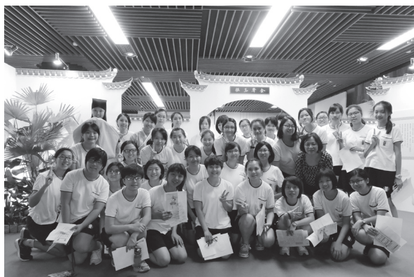
臺北市立第一女子中學師生參觀展覽

時期朗朗上口，影響我們為學處世的老朋友，如八百年前宋代易經參考書《伊川先生點校附音周易》、宋淳熙四年（1177）《禮記》難得一件的蝴蝶裝、還有古人為了幫助考試強化記憶所衍生、創作的各類圖解參考書。您會發現原來古人讀書也是走視覺系路線。還有，從儒家相關書籍的陳列與整理，您也可以一窺儒家精神如何從人物典範、參與政治，教育機構，甚至社會規範，千百年來滲到到東亞文化圈的每一角落，值得我們回味再三。透過欣賞聞名遐邇的清代文淵閣、文瀾閣四庫全書、明代宮廷藏書、清代皇家圖書館-天祿琳琅舊藏，以及歷代著名藏書家，如明代汲古閣毛晉、清代藏書家黃丕烈等，從這些文人雅士，愛書、惜書、手不釋卷的閱讀風範，感受先賢保存圖書的用心。最後提醒自己，閱讀的力量，跨越時空，無遠弗屆。