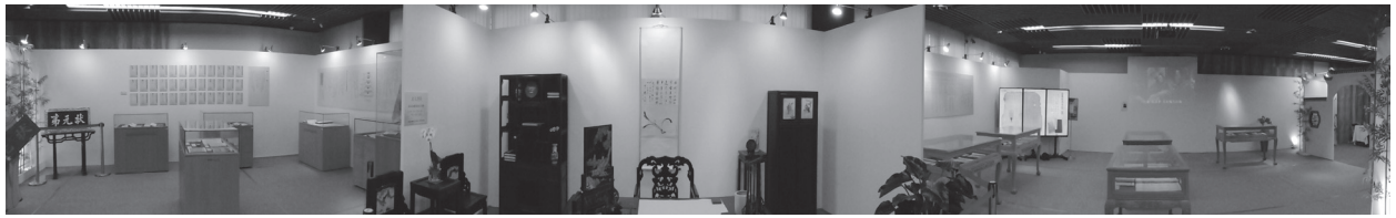
儒家古籍文獻展覽會場全景剪影

廳圖書寮、名古屋市原屬尾張德川家之蓬左文庫，以及舊加賀藩主前田家前田育徳会尊經閣文庫都有典藏。