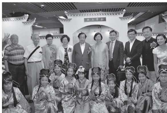
嘉賓與國語實小同學開幕合影