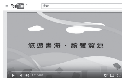
「悠遊書海·讀饗資源」宣傳短片首頁及其連結條碼