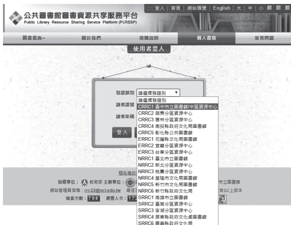
公共圖書館圖書資源共享服務平台首頁示意 ( http://rrcils.ncl.edu.tw )

本館於104年12月獲教育部支持及補助「公共圖書館館藏資源館際互借系統建置計畫」，105年完成公共圖書館館際互借系統—公共圖書館圖書資源共享服務平台( http://rrcils.ncl.edu.tw/ )之建置，並於105年12月1日正式上線提供服務。