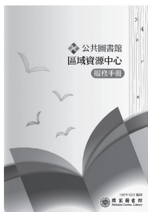
《公共圖書館區域資源中心服務手冊》封面

公共圖書館區域資源中心促進各縣市館藏流通與合作閱讀推廣之服務，打破縣市及地域的限制，提供全民共享之圖書資源，無形中擴增民眾可利用之閱讀資源。尚未體驗暢遊書海樂趣的朋友們，現在就一起到公共圖書館資源中心逛逛吧!! 公共圖書館區域資源中心網頁 ( http://rrc.ncl.edu.tw/ ) 提供資源中心介紹、活動訊息、好書推薦、館藏查詢及服務說明等。若對前述「悠遊書海·讀饗資源」宣傳短片有興趣，歡迎立即掃描下方 QR Code，連結影片了解與認識全國各資源中心的服務。