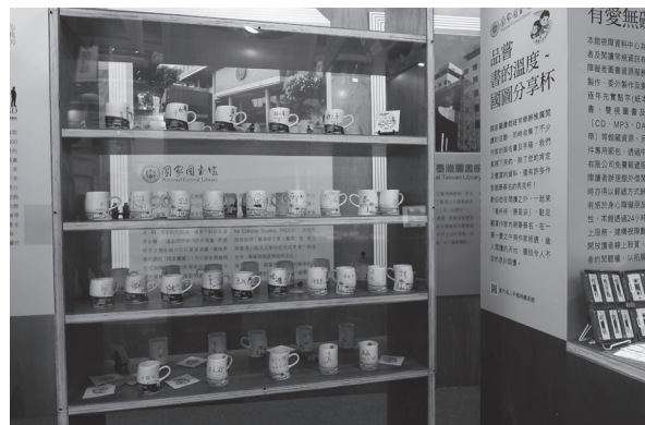
主題展示區「品嚐書的溫度」展示本館蒐藏作家簽名杯