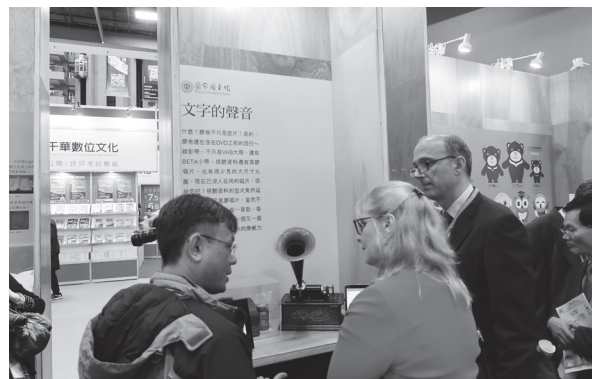
開幕式後同仁為與會貴賓導覽，圖為澳洲、西班牙辦事處代表參觀本館收藏百年留聲機