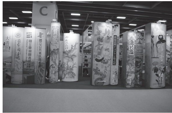
「你我的大書房」展場巨大書牆入口意象

書會和親子繪圖活動，另有「書入熱情，點亮臺灣：電子書捐書冠名活動介紹」、「知識共享，全民閱讀：電子書免費徵集說明」、「桌遊心響受」、「你今天閱讀了嗎？數位普普風」等活動。三館精心設計的活動，吸引不少人潮參加。