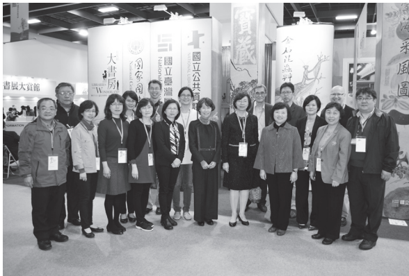
開幕式後本館同仁於展位前合影