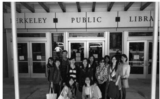
中華民國圖書館界出席ALA年會代表團於6月26日參訪柏克萊公共圖書館並與其亞洲部門主管合影。