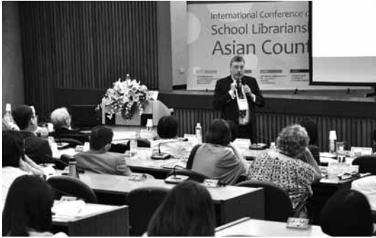
「亞洲學校圖書館發展國際研討會」10月15日第一場次「The Great Fiction/Nonfiction Debate」，由美國南加州大學教授Prof. Stephen Krashen主講。

Libraries, ICADL 2015」(亞太數位圖書館國際會議)，並發表「Digital Reading Behavior of LIS Graduate Students: A Case Study at National Taiwan Normal University」(圖資系所研究生數位閱讀行為：以國立臺灣師範大學為例)及「Ontology-Based Digital Humanities System for the Development of Librarianship in Taiwan」(臺灣圖書館界以本體論為基礎的數位人文系統發展)。