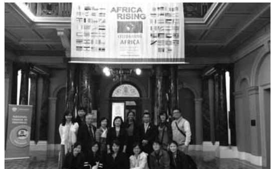
中華民國圖書館界出席IFLA年會代表團於8月17日參訪南非國會圖書館合影