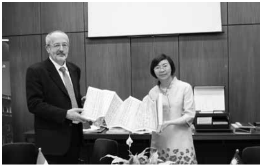
國家圖書館4月10日於匈牙利國家圖書館與該館簽署兩館交流合作備忘錄。

此外，4月10日與匈牙利國家圖書館簽署合作備忘錄，合作推展出版品交換、辦理各種圖書資訊活動交流、國際研討會及展覽等。