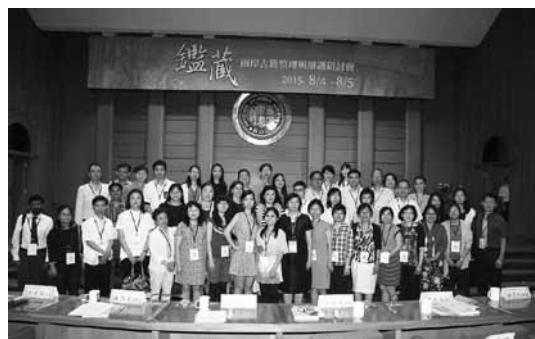
國家圖書館「古與今—古籍維護與當代華文電子資源創新發展研習班」全體學員8月4日於「鑑藏—兩岸古籍整理與維護研討會」會場合影。

(十一) 8月6日至7日假高雄佛光山佛陀紀念館擴大舉辦「第二屆玄覽論壇」，為積極促進兩岸圖書館界交流與合作，國家圖書館賡續與南京圖書館籌辦玄覽論壇活動，並邀請佛光山文教基金會共同合作辦理，協辦單位