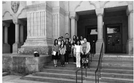
中華民國圖書館界出席ALA年會代表團於6月25日參訪史丹佛大學格林圖書館(Cecil H. Green Library)

二、出席第81屆國際圖書館協會聯盟年會 「世界圖書館與資訊會議：第81屆國際圖書館協會聯盟2015年會及會員大會」(2015 World Library and Information Congress: 81th IFLA General Conference and Assembly) 於8月15日