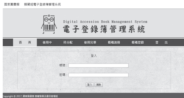
館藏組電子登錄簿管理系統

「館藏組電子登錄簿管理系統」於106年3月15日正式應用於館藏資源條碼控管與登錄簿彙整流程。經由協調溝通與作業流程調整，管理人員與使用人員皆能了解系統之使用與操作方式，以及新的工作流程帶來之便利性。透過線上管理系統，管理人員更能掌控所有條碼之使用情形，同時也提升登錄簿之完整性。