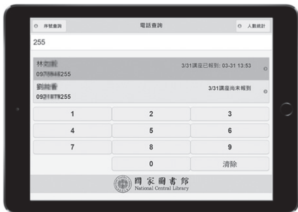
平板顯示報到系統

報名者，接著點選該報名者完成報到手續；除手機末3碼查詢外亦提供姓名查詢與報名序號查詢之功能，以便更精準查詢到報名的人。