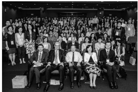
中華圖書資訊館際合作協會第十三屆第一次會員大會於 105 年 5 月 11 日假國立臺灣大學圖書館召開

Collaboration: Is There a Choice?» 專題演講，並安排「館際合作聯盟面對面」座談會，共同分享「臺灣博碩士論文雲端書庫全國聯盟」、「臺灣學術電子書暨資料庫聯盟」、「臺灣 OCLC 管理成員館聯盟」，與「全國學術電子資訊資源共享聯盟」等組織議題。於 6 月 3 日第 13 屆第 1 次理監事會議選舉產生理事長、副理事長、常務理事及常務監事。