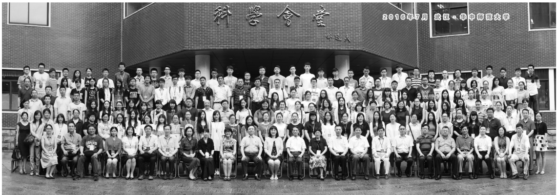
第 13 屆海峽兩岸圖書資訊學學術研討會全體與會者合影