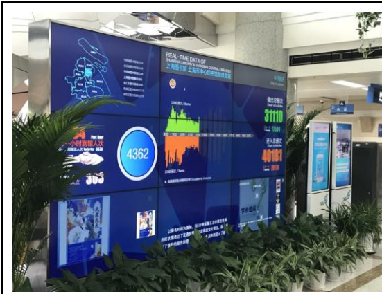
圖十三：上海圖書館電子推播牆