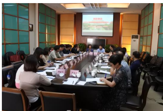
圖二：中國歷史檔案館交流座談