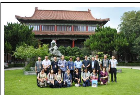
圖一：參訪中國第二歷史檔案館