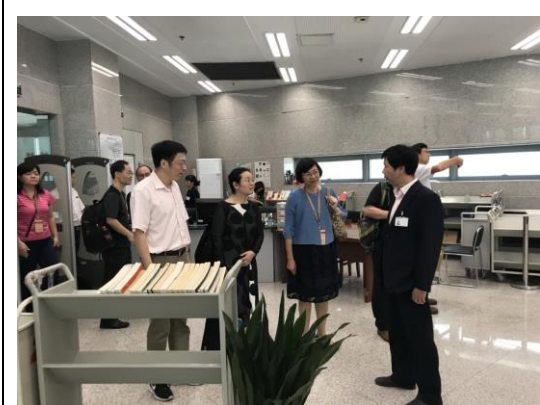
圖二十九：參訪金陵圖書館