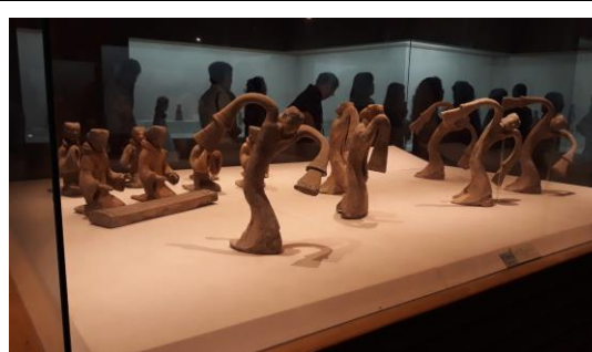
圖二十二：參觀徐州博物館