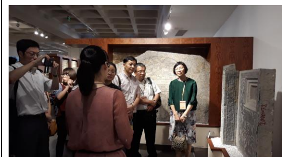
圖二十三：參觀漢畫像石館