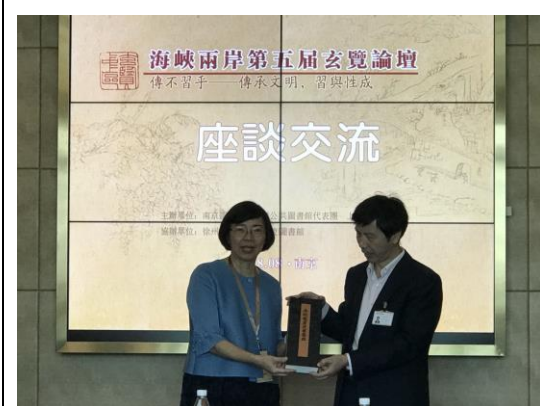
圖三十一：贈書儀式