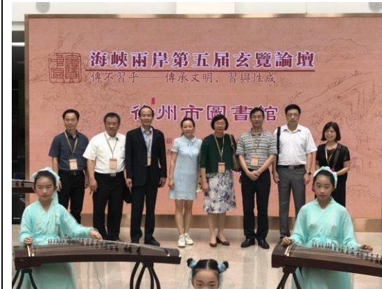
圖十七：參訪團於徐州市圖書館合影留念