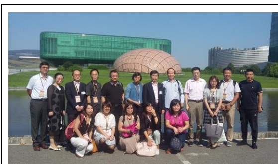
圖二十七：參訪金陵圖書館