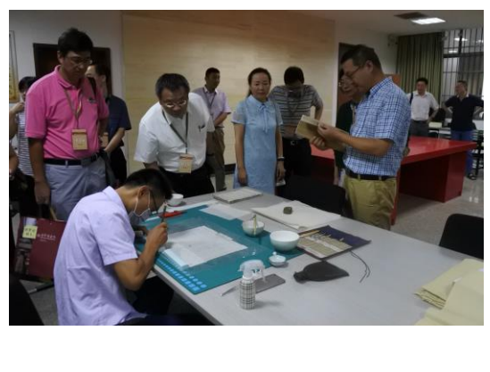
圖十八：參訪團參觀徐州市圖書館古籍修復工作情形