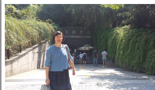
圖三十三：參觀先鋒書店