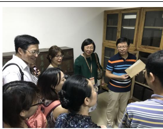
圖二十：參訪徐州市圖書館近代文獻庫