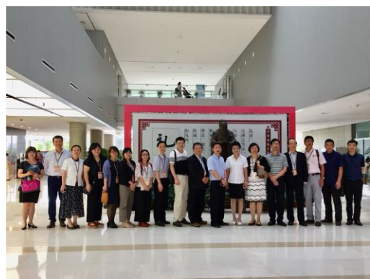
圖九：參訪團於浦東圖書館合影