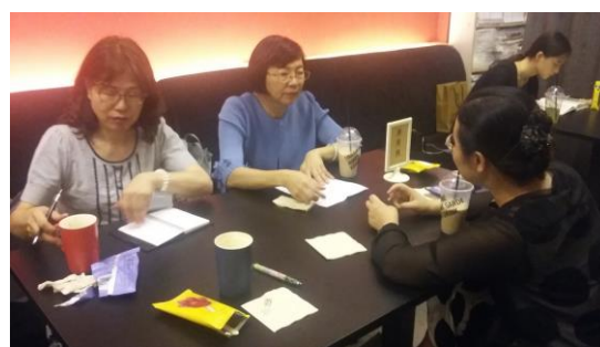
圖三十四：研議下屆論壇辦理方向