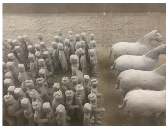
圖二十六：參觀漢文化景區