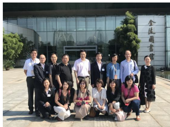
圖三十：參訪金陵圖書館