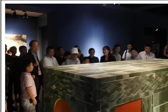
圖二十一：參觀徐州博物館