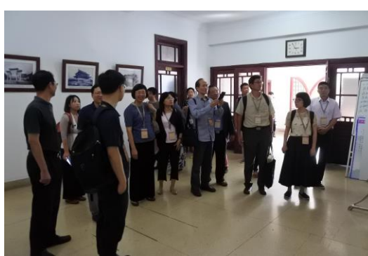
圖四：參觀中國歷史檔案館