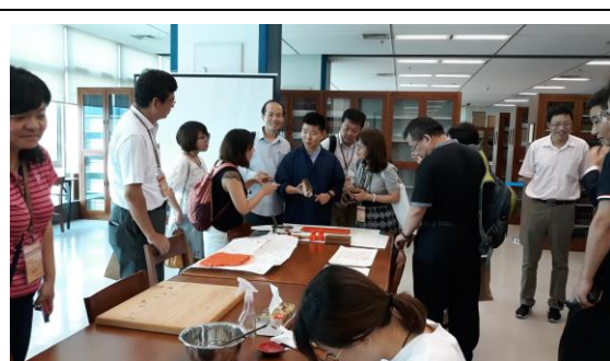
圖二十八：參訪金陵圖書館