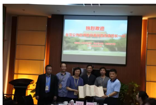
圖三：參訪團與中國歷史檔案館贈書