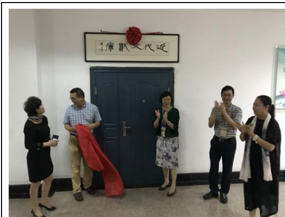
圖十九：徐州市圖書館近代文獻庫揭幕儀式