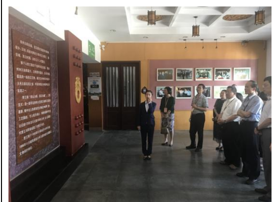
圖二十五：參觀漢文化景區