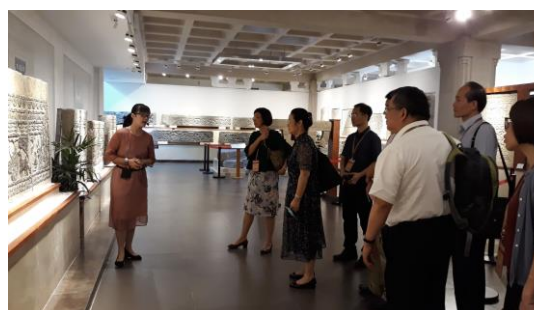
圖二十四：參觀漢畫像石館