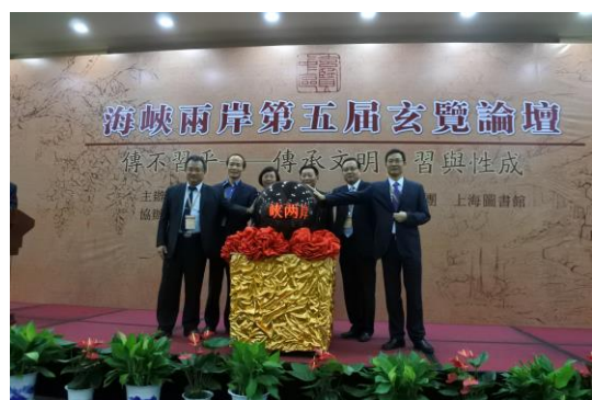
圖五：第五屆玄覽論壇啟動儀式