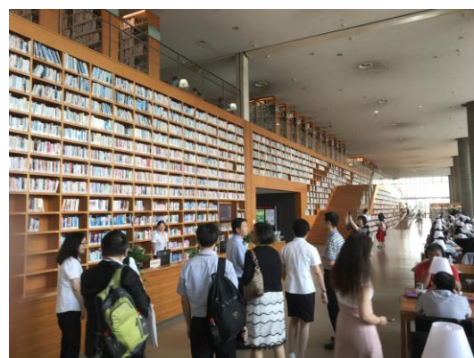
圖十：參訪團參觀浦東圖書館