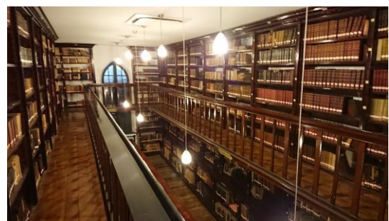
圖十二：上海圖書館徐家匯藏書樓西文書庫