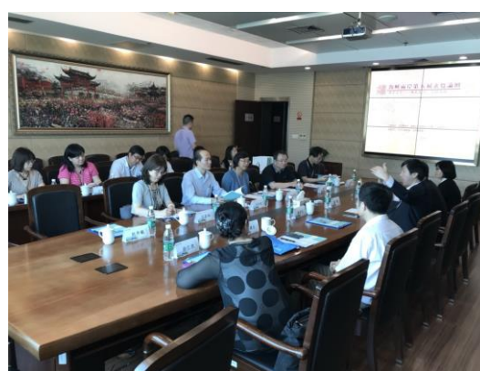
圖三十二：在金陵圖書館辦理座談交流