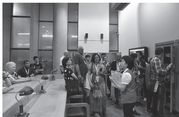
研討會閉幕後由本館同仁帶領與會者進行館內導覽（107年9月28日）