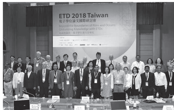
主講人、NDLTD委員及國外與會者、教育部林騰蛟次長(右8)，以及國家圖書館曾淑賢館長(左6)於開幕典禮合影。(107年9月26日)