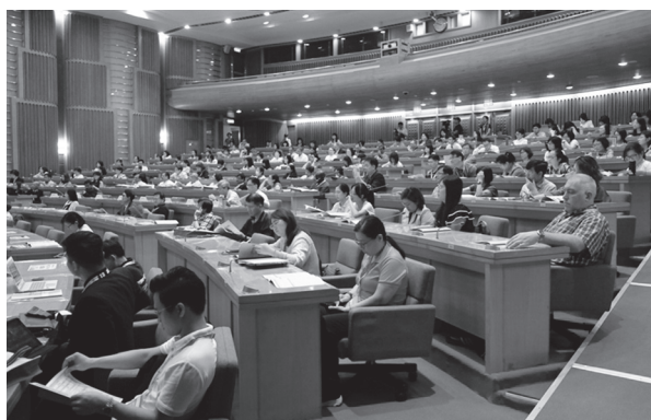
與會者於本館國際會議廳聽講（107年9月26日）

交，從閉幕典禮全體與會者二度起立鼓掌，到陸續接獲國外學者的感謝信，在在都肯定國圖成功舉辦了NDLTD歷年來最精彩的電子學位論文國際學術研討會。本館也透過此次盛會達成向世界分享臺灣成功經驗的目標，對於增進國際社會對臺灣進步與實力的瞭解，以及對外關係的拓展多所助益。