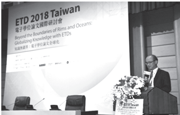
教育部林騰蛟次長於開幕典禮致詞（107年9月26日）

9月26日研討會正式開幕，教育部林騰蛟次長代表葉俊榮部長出席致詞，並參與開幕典禮以及歡迎晚宴。今年的ETD 2018 Taiwan為第21屆，本館非常榮幸能夠接待來自世界各國的與會代表，共同參與此一國際學術盛會。本屆ETD研討會的主題為「知識無疆界：電子學位論文全球化 Beyond the Boundaries of Rims and Oceans: Globalizing Knowledge with ETDs」，共計212人與會，出席者來自全球共14個國家，包括德國、美國、中國大陸、新加坡、印度、伊朗、加拿大、澳洲、泰國、巴西、法國、菲律賓、日本、英國及韓國等。