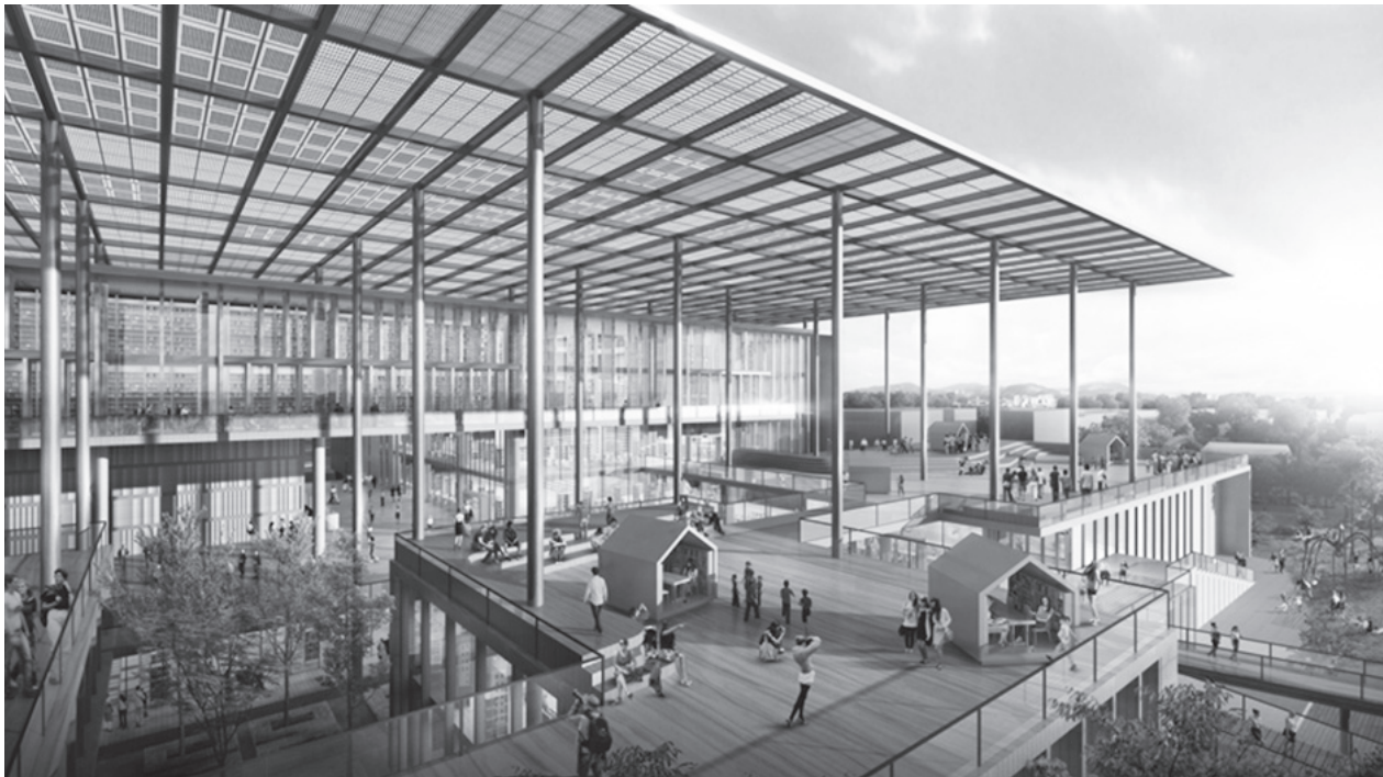
太陽能天棚（國圖南館示意圖，由九典聯合建築師事務所提供）