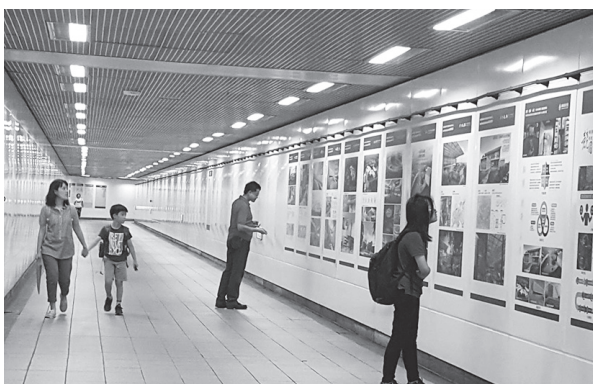
競圖成果展（臺北捷運中正紀念堂站6號出口廊道，107年9月14日）