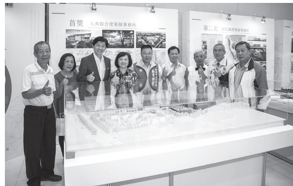
競圖成果展（臺南市新營文化中心，107年9月4日）