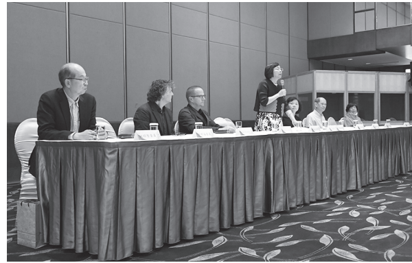
曾館長宣布評選結果（臺南市評選會場，107年8月30日）