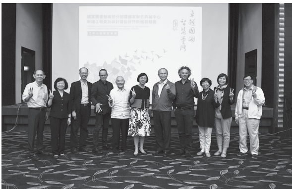
評選委員合照（臺南市評選會場，107年8月30日）

本案後續之2場競圖成果展已分別於9月4日至11日在臺南市新營文化中心演藝廳1樓大廳及9月14日至21日在本館1樓簡報室穿堂舉辦，展出5家優勝廠商建築模型及相關圖件，除可讓民眾近距離欣賞瞭解所有優秀建築團隊的作品，更期盼讓民眾共睹國圖南館未來的發展願景，一睹政府對文化建設投資之樣貌，引領民眾對閱讀及學術研究新世代的期待。同時，於9月14日起至10月底止在捷運中正紀念堂站6號出口廊道牆面張貼競圖優勝廠商作品海報，提供民眾於大眾運輸車站同步參與競圖成果機會，以及宣揚國家重大公共建設。