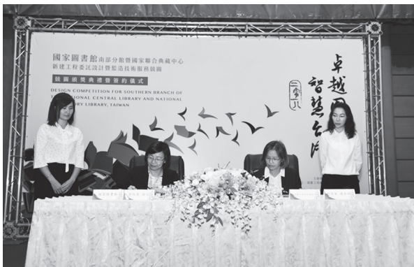
頒獎典禮暨簽約儀式（本館國際會議廳，107年9月14日）

教育部林次長於致詞中首先感謝行政院賴院長在臺南市長任內，以及現在臺南市府團隊對此建設的高度支持，無償提供新營區的文教11用地，讓國家圖書館長久以來服務南部民眾的夢