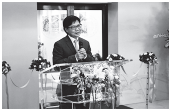
葉俊榮部長致詞（107年7月31日）

「記憶臺灣—梁丹丰寶島風情畫特展」於本（107）年7月31日下午2點在文教區展覽室前舉辦揭幕剪綵。本次展出梁丹丰教授有關臺灣之畫作，包括油彩、水彩、素描等各類表現約300幅，開幕有各界來賓100餘人參加觀禮，盛況空前。人文素養極高，喜歡寫詩、作畫、歌唱的教育部葉俊榮部長親臨致詞並為畫展開幕剪綵。