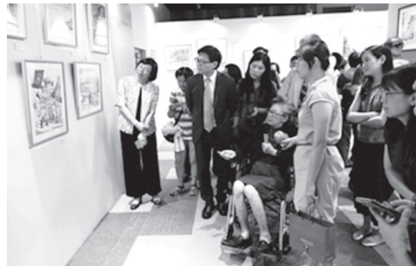
梁丹丰教授導覽實況，葉俊榮部長(左2)

丰教授與臺灣相關的水彩、素描、油畫、粉彩等作品計584幅，與本館辦理的「記憶臺灣—梁丹丰寶島風情畫特展」相互輝映，琳瑯滿目，美不勝收。該書圖畫作品以臺灣地理區域劃分，計分基隆新北、臺北、桃竹苗、中彰投、雲嘉南、高屏、宜花東、澎金馬8部，這些畫面把我們的生活串在一起，更豐富我們對臺灣的記憶。