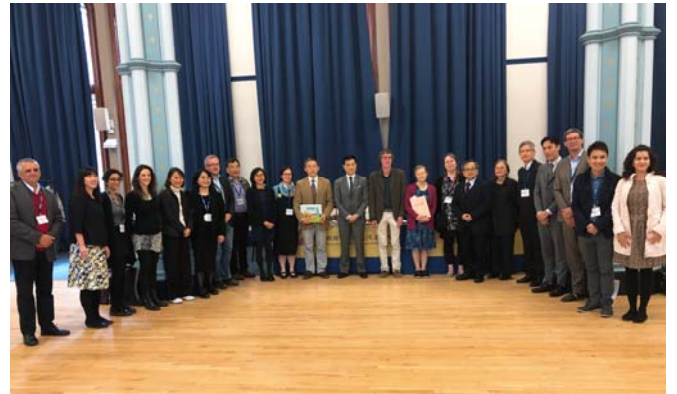
贈書儀式學人觀禮陣容