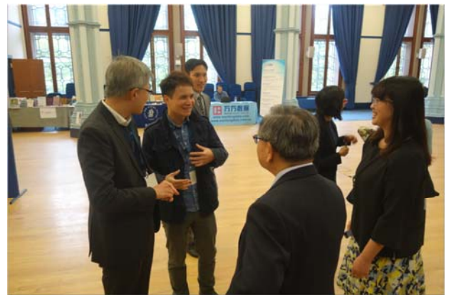
贈書儀式結束與學人交流