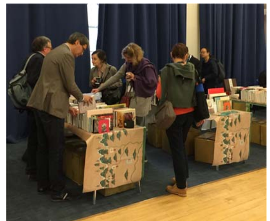
瀏覽圖書展示的學人