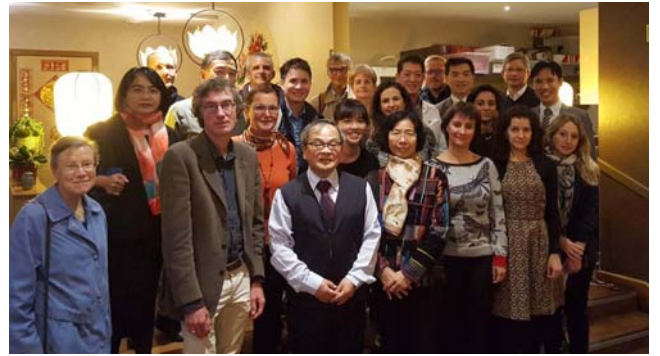
參與世界漢學學友會學人合影