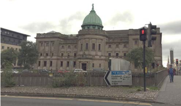
米契爾圖書館外觀