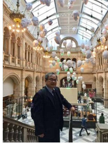
凱文葛羅夫藝術博物館

凱文葛羅夫藝術博物館1901年開放，它擁有世界上最好的武器和裝甲收藏之一，以及大量的自然史收藏品。藝術藏品包括許多優秀的歐洲藝術品，作品包括老大師（Old Master）、法國印象派、荷蘭文藝復興、蘇格蘭色彩畫家以及格拉斯哥學派。