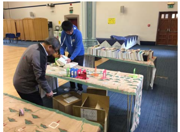
布置第二批到達圖書