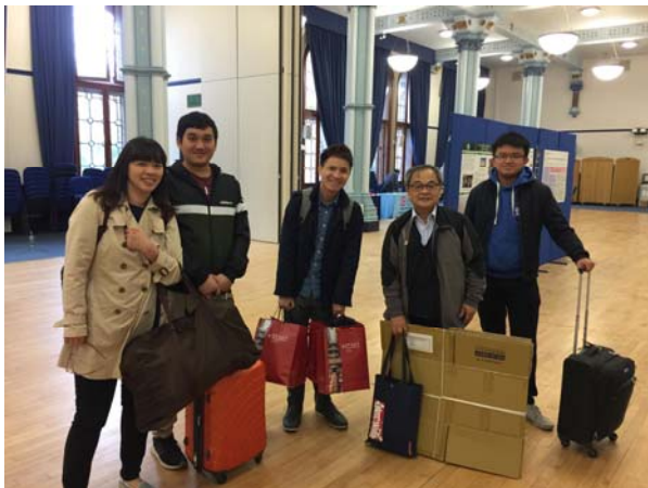
EACS書展結束與學人及工作人員合影