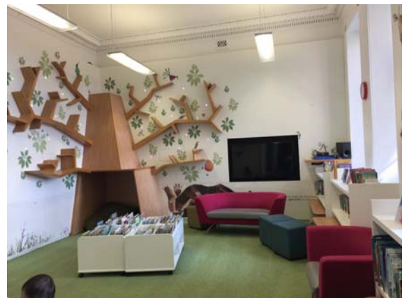
愛丁堡中央圖書館兒童圖書館

愛丁堡中央圖書館建造1890年，它座落在愛丁堡的舊城區和新城區之間的世界遺產的心臟地帶。分為五個不同的圖書館。