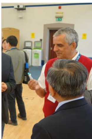
贈書儀式結束與學人交流