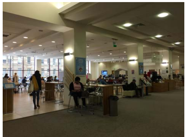
米契爾圖書館大廳