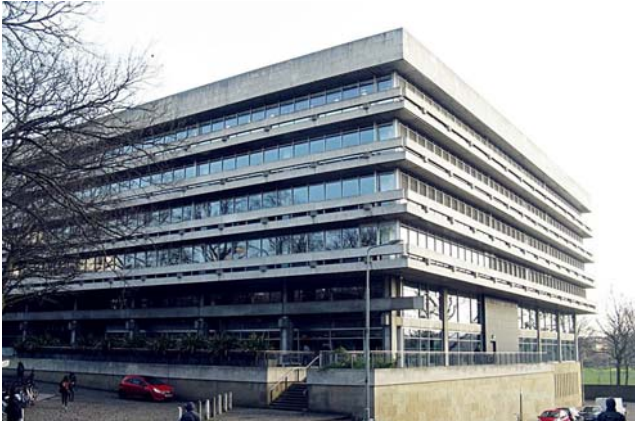
愛丁堡大學圖書館外觀