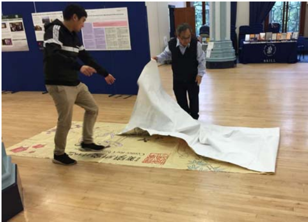
EACS書展結束整理場地