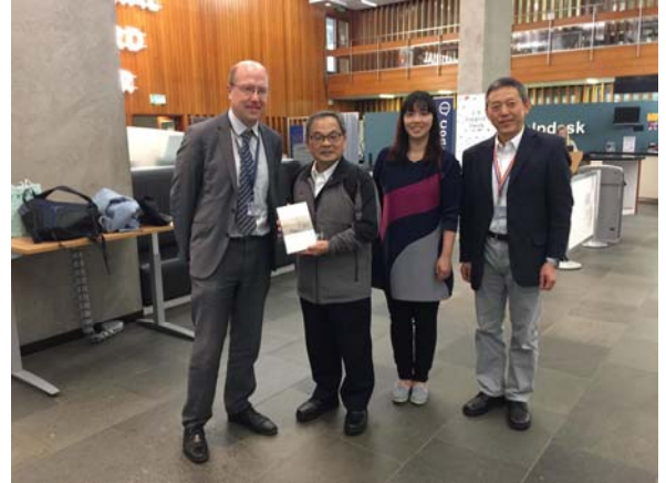
愛丁堡大學圖書館