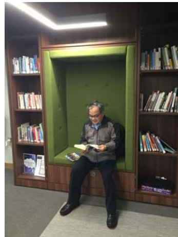
格拉斯哥大學圖書館閱覽區