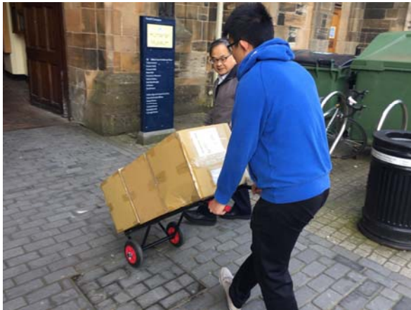
搬運第二批到達圖書