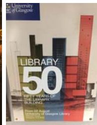
格拉斯哥大學圖書館開幕於1968年。今年正好50年。