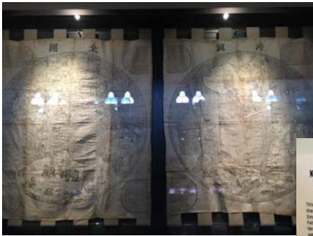
KUNYU QUANTU 坤輿全圖 (A MAP OF THE WHOLE WORLD) BY FERDINAND VERBIEST, 1674. This map showing the two hemispheres of the world was designed for the Chinese Emperor Kangxi (1662-1722) by the Jesuit Father Ferdinand Verbiest (1623-1687). Verbiest was one of a handful of Jesuits who were employed at the Chinese court during the 17th century and who introduced Western science to China. Printed from woodblock using Verbiest's projection (a cylindrical map projection which causes a stretching of the map towards the poles), the map was part of a larger geographical work called Kunyu Suanpan (Geometrical Calculation of the Spheroids of the World), which included information on different lands as well as the physical map itself.