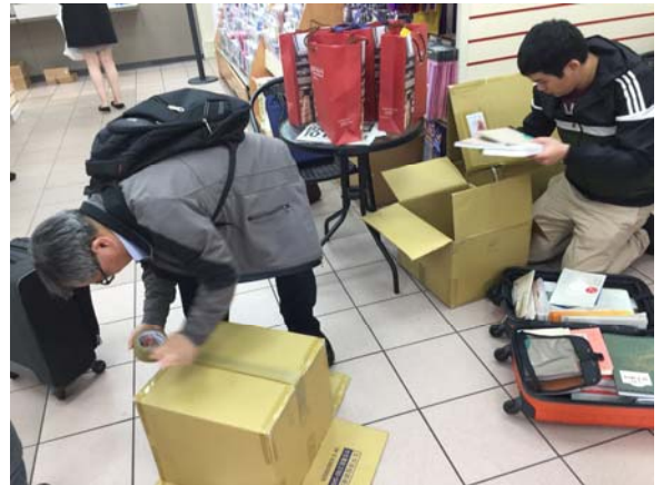
EACS書展結束打包書籍