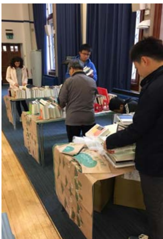
第二批到達圖書展示