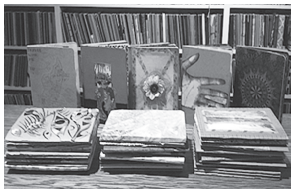
Bookly Art Library所展示的素描簿完成品 ( https://www.culturalweekly.com/brooklyn-art-library-sketchbook-project/ )