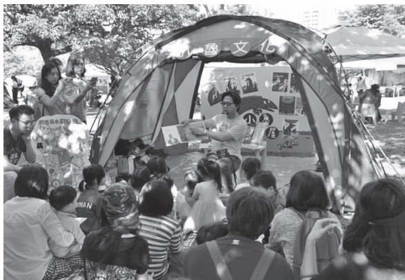
教育部長葉俊榮到森林故事村為小朋友說故事