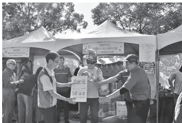
教育部長葉俊榮參與閱讀黃金十年成果展攤位

臺灣閱讀節的重點活動—閱讀嘉年華會為全國引頸期盼的重要年度盛會，展現圖書館閱讀推廣的熱情，也是閱讀黃金十年一路走來重要的成果，希望藉由辦理全國大型閱讀節慶喚醒民眾找回閱讀的樂趣，用閱讀改變人生。107年的活動內容包括：