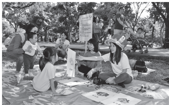
小小愛書人之唱唱兒歌關卡