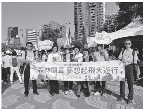
森林閱章夢想起飛大遊行

閱讀嘉年華於12月1日（星期六）在大安森林公園盛大登場，由曾淑賢館長、教育部終身教育司黃月麗司長及多位長官，率領逾500位愛閱的朋友來一場「森林閱章·夢想起飛大遊行」，行經信義路、永康街、東門市場等街區，與民眾分享閱讀的美好。遊行結束隊伍進入露天音樂臺參與「閱讀嘉年華開幕暨圖書館傑出人士貢獻獎頒獎典禮」後，10支遊行隊伍與2隊表演團隊，依序上台表演，經評審評分由苗栗縣三灣鄉公所（苗栗縣三灣鄉愛閱團）、新竹縣立員東國民中學（客庄矮靈舞精靈）、新北市立圖書館（閱讀夢幻島）獲得前三名，由曾淑賢館長頒發禮券表揚。