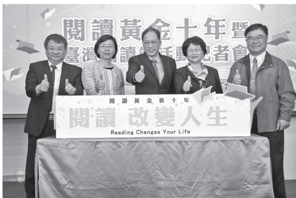
閱讀黃金十年暨臺灣閱讀節活動記者會