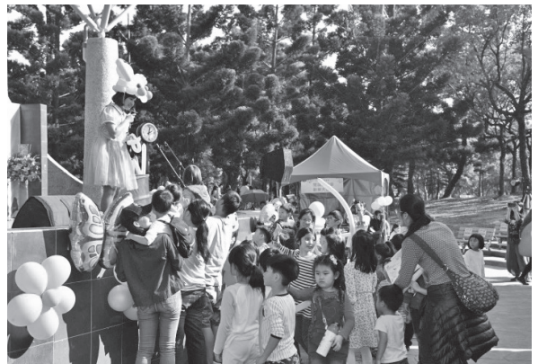
閱讀繽紛樂·歡樂大放頌造型故事演說—嘎嘎汽球

露天音樂臺下午由「閱讀繽紛樂·歡樂大放頌」接力為民眾帶來精采表演，首先嘎嘎汽球老師穿著色彩繽紛的造型汽球公主裝，一出場就吸引全場小朋友的注意，老師將一根根汽球，折一折，彎一彎，馬上幻化為一把劍、一頂帽子、一隻小狗，讓現場小朋友驚呼連連。接著「聽繪本·猜繪本·講繪本」、「創作樂團演唱」、「印尼舞蹈表演」、「愛樂管樂表演」、「熱舞表演」、「手語舞蹈表演」輪翻上陣帶來精彩表演，最後由小百合壓軸演唱經典民歌，活動間穿插抽獎活動，讓民眾度過歡樂的假日午後時光。