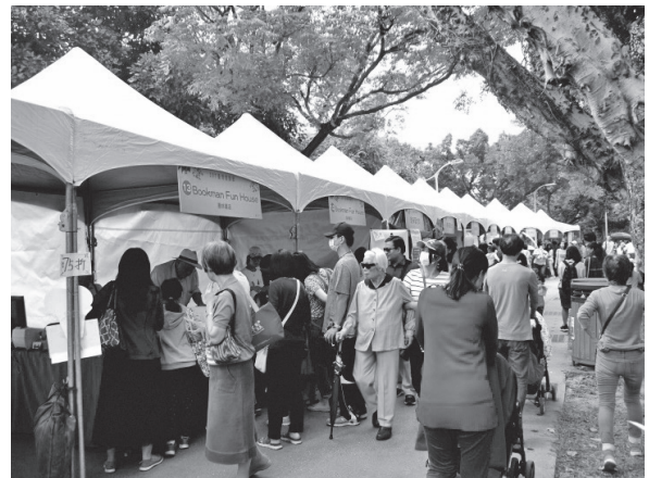
書香大市集活動精彩多元吸引民眾流連

而深受民眾喜愛的Q版漫畫人像，多位畫家以簡潔熟練的技法將Q版人像漫畫以活潑、趣味的風格呈現，為現場參與民眾畫出滿心的歡樂。此外，也提供童玩如捏麵人、竹筷槍及吸管編等教學，讓父母重溫懷舊的童年回憶，更帶給小朋友充滿新奇和趣味性的童年遊戲。