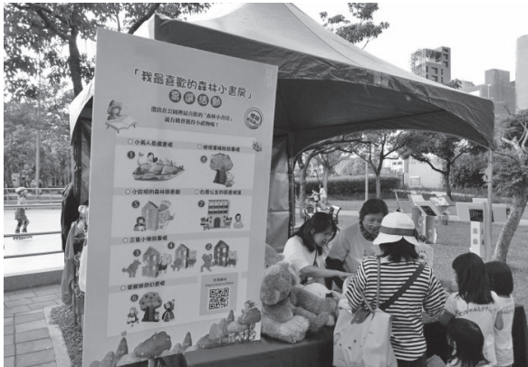
森林小書房票選活動

得出版社授權製作6本大書設置「閱讀大書區」，並提供小型音箱播放故事音檔，還有角色扮演道具，供親子於閱讀大書區一邊拍照一邊翻閱讀大書，讓閱讀活動變得更有趣更好玩。另設置「漂書區」，向各界商借具特色造型之漂書架，以增添活動可看性並彰顯各單位推廣閱讀的成效。配合8處造型書架，辦理「我最喜歡的森林小書房」票選活動，民眾踴躍參與投票。