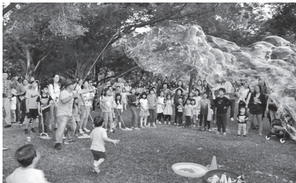
森林·飛行·科普樂之吹泡泡表演

「森林·飛行·科普樂」活動主軸為DIY遊戲與科學，讓孩子折紙飛機、吹泡泡、玩火箭車，從生活中接觸科學，尤以吹泡泡表演最受歡迎，當老師吹出大量泡泡的瞬間，每每引起小朋友瘋狂追逐，歡笑聲不絕於耳。