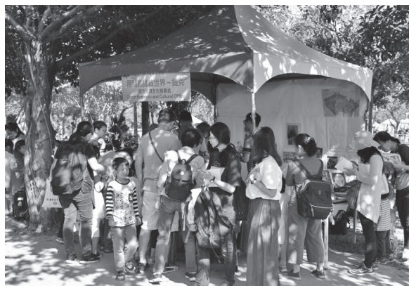
用閱讀拯救世界活動攤位人潮洶湧

以閱讀與世界文化為主軸，由本館、捷克經濟文化辦事處、印度台北協會、德國文化中心、墨西哥商務簽證文件暨文化辦事處、澳洲辦事處等五個駐台辦事處規劃6道關卡。民眾領取世界地圖集章卡，透過闖關瞭解各國文化。另現場設置世界閱讀區，精選陳列與各國文化相關書籍以供現場民眾於活動中或於闖關結束後，於現場自由翻閱，有效深化本活動效益。