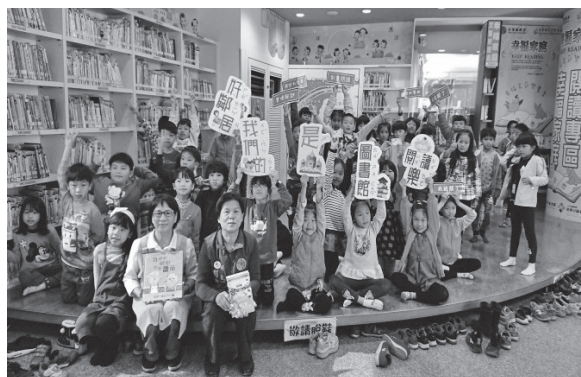
苗栗縣政府教育處全國愛閱小尖兵活動（107年12月12日）

國家圖書館首創以早期素養為推動重點，邀請全國公共圖書館共同響應，以3-6歲幼兒為對象，透過聽、說、讀、寫、玩活動的設計與活動的帶領，讓幼兒接觸文字及書本，讓孩子成為小小愛書人。本年度總計有9個單位合作辦理，3,200人參加。