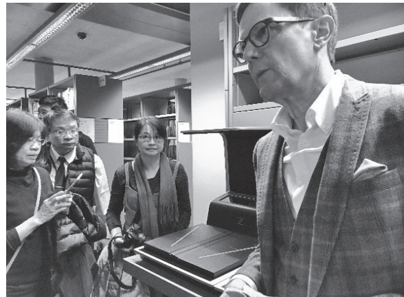
柏林自由大學語文學院圖書館Werner館長為代表團團員導覽（2018年11月1日）

此館的館藏以語言文字學和文學領域的書籍為主，整併原本11個相關系所圖書館的館藏。館內98%的藏書都放在開架書區，僅有少數必須從書庫調閱。內部空間以白色與各種深淺的灰色為主要色調，僅在兩邊的出入口採用明亮的橘黃色。此外，為增加閱讀空間，館員辦公室設在鄰近的建築內，並透過地下通道與此館相連結。此外，該館在節能設計上也頗具巧思，建築配合柏林當地的氣候環境，藉由風力和太陽能維持館內的舒適恆溫，使得一年中大約60%的日子都不需啟動空調設備。另，該館的贊助協會（Förderkreis Philologische Bibliothek e.V.）以大學生義工為營運主力，並靠販