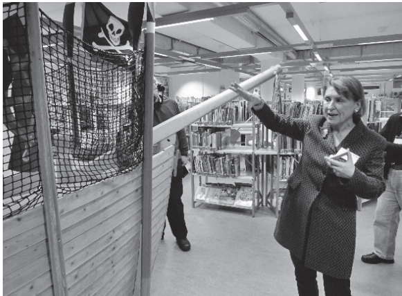
不來梅市立圖書館Lison館長為團員講解該館親子閱覽區的空間規劃（2018年10月30日）

讓兒童感覺自己受到重視。此外圖書館入口外中庭的閱讀花園（Lesegarten）、館內所設全德國唯一的「偵探小說圖書館」（Krimibibliothek）與青少年的專屬空間等，這些都讓團員留下深刻的印象。