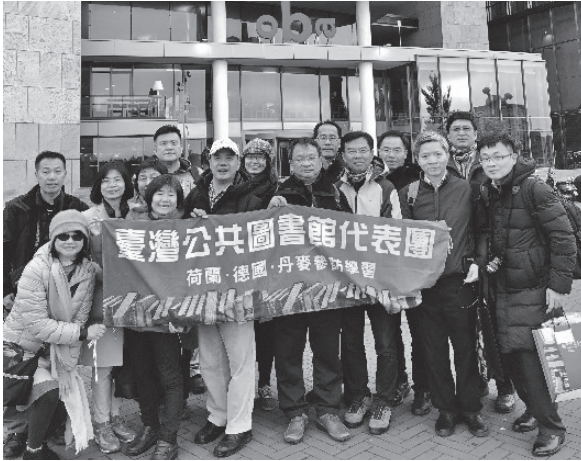
代表團團員於荷蘭阿姆斯特丹公共圖書館前合影(2018年10月29日)

書區。這個區域除提供兒童圖書以及親子共同閱讀的空間之外，也有兒童實驗室以及一件袖珍藝術品「老鼠之家」(Het Muizenhuis)。此外，地上七樓的自助餐廳(V&D La Place)也有可以眺望阿姆斯特丹的市景觀景平台，是此館重要的特色之一。