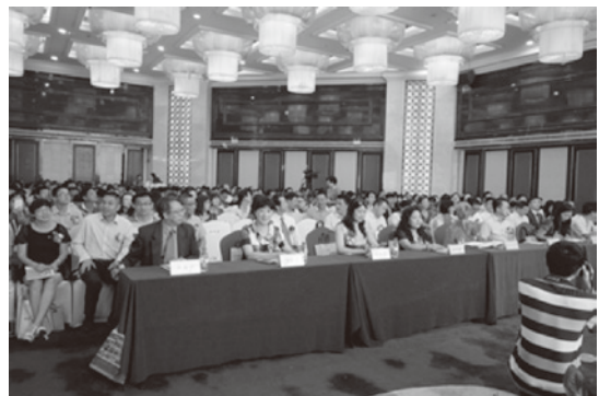
圖 62 106 年臺灣學校圖書館館員學會 (TTLA) 國際交流參訪活動