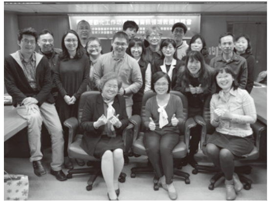
圖 61 「教育遊戲化工作坊暨圖書資訊領域教師餐敘聯誼會」全體與會者合影