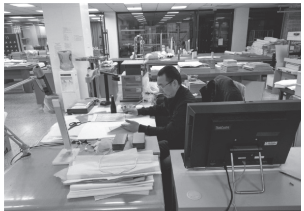
修復人員進行古籍修復工作

北京國家圖書館持續的進行古籍修復，由「趙城金藏」、「永樂大典」、敦煌遺書和西夏文獻，現在則集中全力在修復天祿琳琅，擁有許多修復古籍的經驗，為了瞭解北京國圖在古籍修復的狀況，在參觀完古籍大展後，利用地利之便，參觀了位於同地的古籍修護室，其古籍修護室分為2個地點，1在總館，1在文津街古籍館，北京國圖之古籍修護大部分在總館，正式在編的修復人員約15位，總館約有10位，每位修護師拿到1本古籍後，從拍照、建檔到修護完成，都由1人負責，如此，除了可追蹤古籍的修復過程外，也保證了修護的一致性。修護是綜合性的學科，要用到很多方面的知識，包括古籍修護、化學或紙張保護等，在人員上，除了本身的學科外，均要與老師傅進行學習，出師後，才可自己獨立進行修護工作。