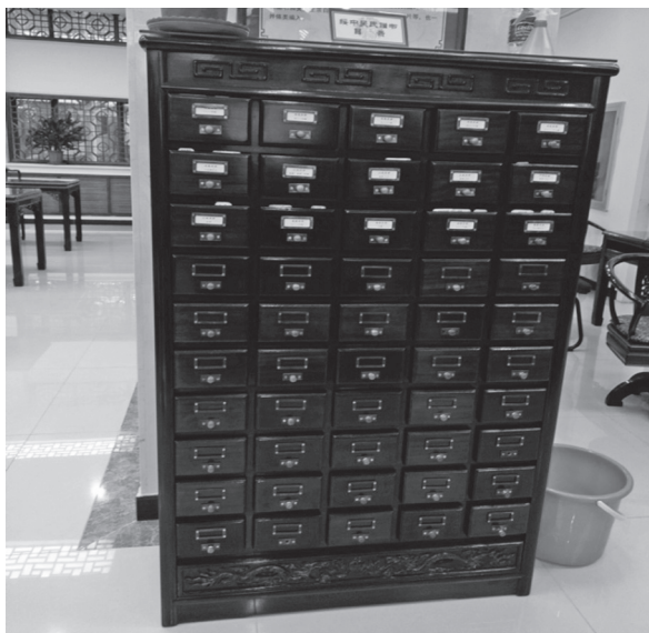
「綏中吳氏贈書」卡片目錄

由於北京市收藏大量古籍文獻的單位較多，如北京國家圖書館、北京大學等，因此一般需研究古籍的人員，大都會前往上述地點進行古籍研究。首圖古籍文獻的來源，主要源於京師三館舊藏、孔德學校圖書館藏書、法文圖書館舊藏。其認為古籍主要以保存為主，用的越多，毀壞越多，因此首圖的政策是將古籍數位化，不推薦讀者使用古籍原件，如需提閱原件，需有介紹信。其有2個自建資料庫：古籍插圖庫及古籍珍善本圖像數據庫，插圖是該中心館藏戲曲小說的特色，其館藏有一批為著名的戲曲小說研究家吳曉鈴先生捐贈的藏書，共計2,272種，6,362冊，豐富了首圖在小說、戲曲、曲藝等方面的館藏，相當珍貴。因此首圖為保持吳先生藏書之系統性及完整性，特別設置「綏中吳氏贈書」專藏。