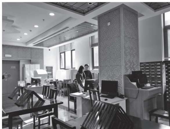
北京大學古籍圖書館閱覽區

北京大學圖書館古籍資料服務中心共分4個部門：典藏閱覽組、古籍整理組、古籍保護組及拓片組，工作人員共有20人，自從古籍部從主圖書館搬到沙特國王圖書館北大分館，閱覽區的面積就變小了，僅有約20席位，為控制人數，設有一預約平台，開放給校內人員於2個星期前做線上預約。沙特國王圖書館北大分館的地下2-3樓以及地上2-3樓，則用於存放、管理、編目和修繕北大圖書館現存的古籍文獻。