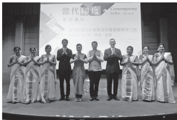
第四場印度講座舞團與貴賓合影(109年1月17日)

此場演講讓與會民眾深度瞭解當代印度文化發展、習藝歷程及認識摩希尼亞坦古典舞蹈形式，同時渡過了一段知性的午後時光，在Q&A後為整場講座畫下完美的句點。(國際合作組許琇媛)