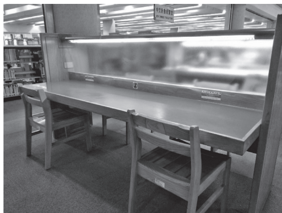
於閱覽桌中間黏貼PVC塑膠布，阻隔飛沫。（109年3月23日）

為避免因群聚討論造成交叉感染，自3月26日起停止團體討論室之預約使用；另自4月1日起，已使用期滿之研究小間暫時由本館作為疫情防範措施運用，疫情期間不再受理民眾申請使用。（知識服務組蔡承穎）