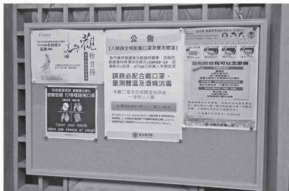
製作各項防疫措施公告