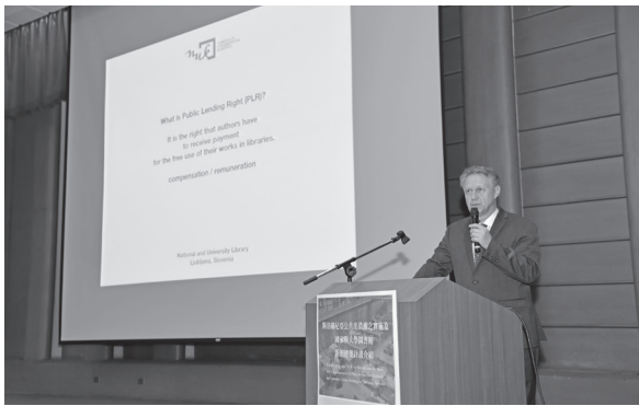
斯洛維尼亞國家圖書館Viljem Leban館長演講(109年1月15日)

本館於109年迎接開春之際，特別邀請斯洛維尼亞國家圖書館館長Mr. Viljem Leban於1月15日蒞館專題演講，於上午10時至12時在本館藝文中心3樓國際會議廳舉行，講題是“Public lending right (PLR) in Slovenia and the rules of its implementation & Plans for the New National and University Library Building in Ljubljana, Slovenia.”（斯洛維尼亞公共出借權之實施及國家與大學圖書館新館建築計畫介紹）。