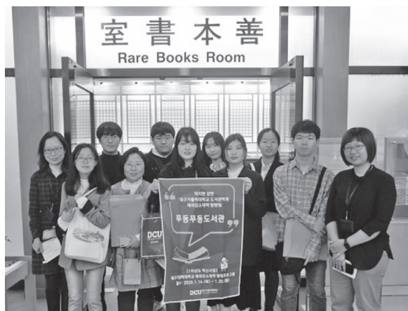
韓國大邱天主教大學參訪團於本館善本書室合影(109年1月16日)

化服務、讀者類型等相關問題進行討論交流。參訪團對本館古籍文獻典藏留下深刻印象。（國際合作組許琇媛）