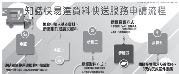
知識快易達快送服務申請流程