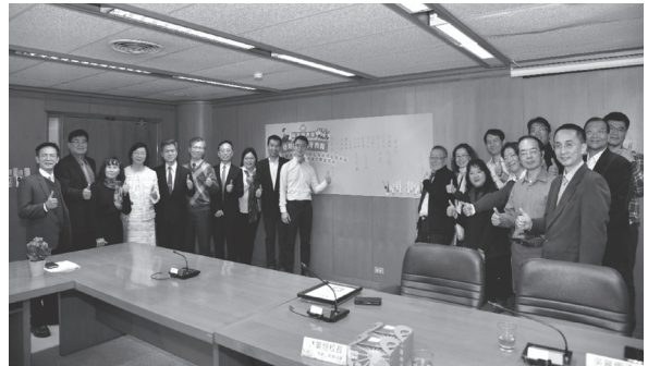
與會者於合作計畫啟動簽名板前合影(109年1月14日)