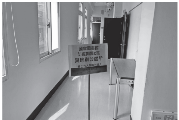
分區異地辦公C區演練情形(109年3月27日)