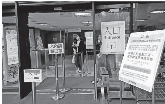
本館自修室入口防疫管制措施