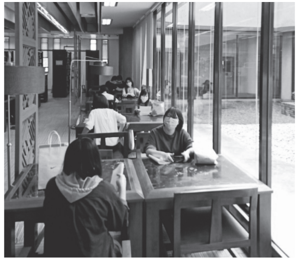
分區異地辦公A區演練(109年3月27日)