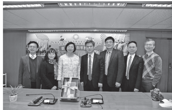
彭富源署長（左四）、曾淑賢館長（左三）及與會高中校長合影（109年1月14日）

本館於本（109）年1月14日舉行「百年教育文獻資源合作數位化及臺灣記憶系統共建共享計畫」簽約儀式暨感恩會，邀請教育部國民及學前教育署彭署長富源以及建國中學、虎尾高中、中山女中、臺南一中、臺南二中、臺南女中、臺中女中、高雄中學、屏東高中、屏東女中、新竹高中、基隆女中、成功高中、臺南高商、花蓮女中、嘉義女中、彰化女中及新竹女中等18所高中（職）共同參與合作計畫啟動儀式。