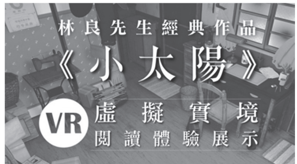
印象太陽VR作品主視覺

教育雲：教育大市集（提供教案下載） https://market.cloud.edu.tw/