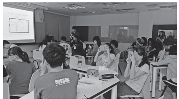
於科園實中辦理教學觀摩現場，以Cardborad等多元方式讓學生體驗VR(108年6月13日)

以下則就「印象太陽VR」之製作緣起、文本選擇、詮釋角度及沉浸式內容製作等進行內容說明與介紹。