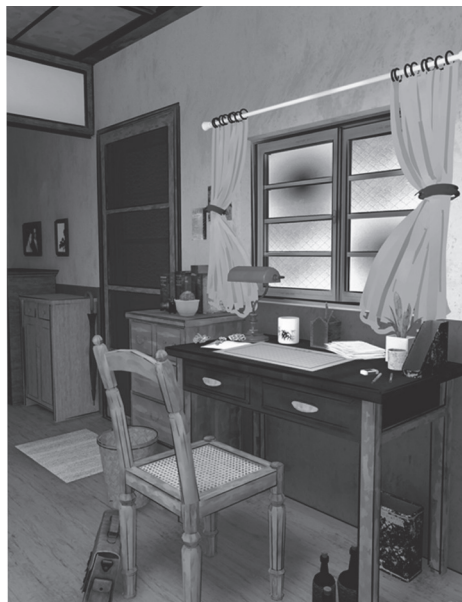
印象太陽VR作品「一間房的家」場景：作家書桌

描述，將室內家具、人物衣著等進行模型與貼圖細節上的設定，以符合當年時空背景。為了讓使用者可以跟隨導演的視角進行體驗，我們針對文本及動畫內容，討論其視覺引導路線，引導使用者可以跟隨導引球轉換視角體驗到不同的場景呈現，亦不會遺漏重要畫面。在利用林良的文字及配音旁白時，亦讓使用者跟隨文字移動視角到能適當觀看動畫的角度；而音效設計上，亦針對文本與空間進行3D音效與背景音樂的設計，讓使用者能夠根據音源觀看劇情設計。