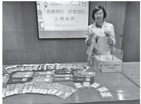
曾館長公開抽出「與書同行·好禮相送」(5-6月)跨館借閱活動得獎者(109年7月28日)

上述3項活動自本(109)年5月1日至8月31日截止，歡迎民眾線上探索好書( http://beonline.ncl.edu.tw/ )，分享閱讀金句，抽好禮。