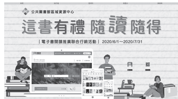
「這書有禮，隨讀隨得」電子書閱讀推廣聯合行銷活動網頁

為期2個月的電子書閱讀推廣活動，參加人數共有776位，總借閱冊數達6,347冊，比前一年同期借閱人數增加2.6倍（297位），總借閱冊數增加超過6倍（1,019冊），值此防疫期間，民眾減少外出之際，有效推廣電子書利用，進而提升讀者線上閱讀習慣，達到博覽群書不受時空限制與自在學習之目的。