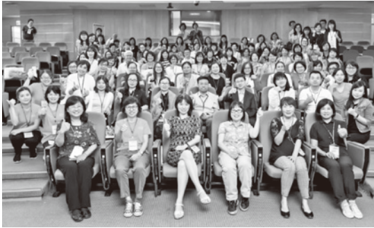
圖 70 臺灣醫學圖書館學會 2018 年會暨第 40 屆醫學圖書館工作人員研討會，107 年 8 月 23 日及 24 日假桃園長庚醫院召開。

試。共計有 23 名醫學圖書館工作人員報考，16 名通過考試（含以著作申請認證者），取得學會頒發的「高級醫學圖書館管理師」證書。（黃素英）。