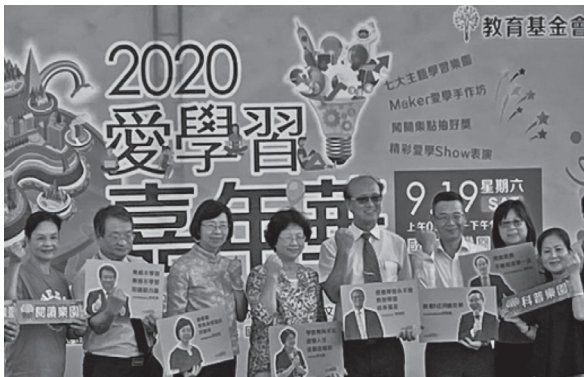
教育部林騰蛟次長（左起5）、終身教育司黃月麗司長（左起4）及曾淑賢館長（左起3）出席活動開幕儀式。（109年9月19日）

現場參與民眾踴躍，活動攤位人潮絡繹不絕，體驗趣味問答之餘亦汲取學習新知，創造歡樂共學之熱絡氛圍，參與之民眾皆表示收穫滿囊，給予大朋友小朋友一段充實豐富的週末時光。（圖書館事業發展組）