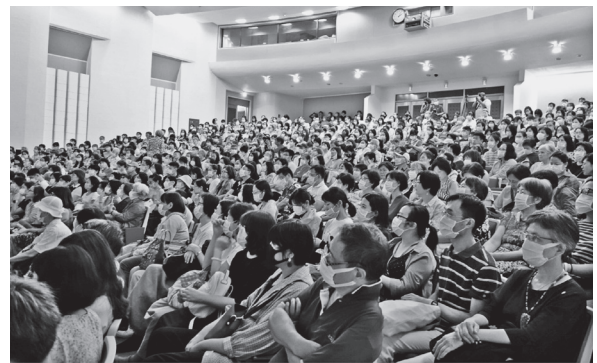
系列講座吸引500多位觀眾的熱情參與，全場座無虛席（109年7月12日）