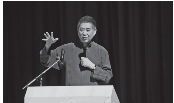
文學大師白先勇生動精彩的演講風采（109年7月26日）

樓夢》人物的鑽研體會，傾囊相授，深獲在場民眾的共鳴，也引發大家因理解而生的笑意，讓與會民眾在白氏紅樓文學的經典薰陶中度过愉悅與充實的午後時光。（館藏發展與書目管理組陳姿吟）