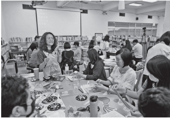
學員認真投入製作活動教具（109年7月31日）