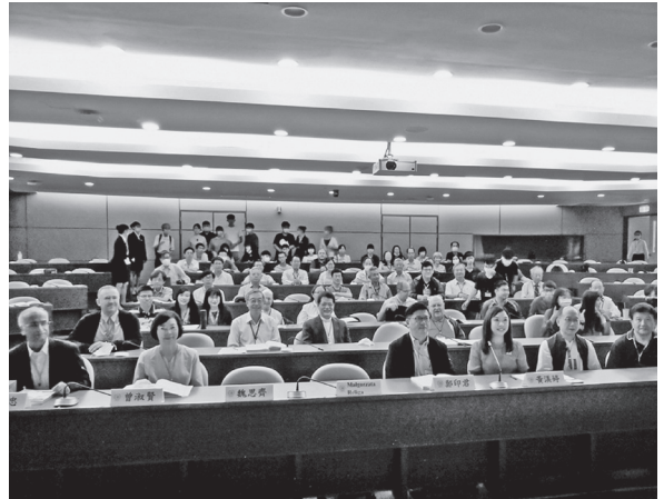
與會學者合影（109年9月23日）

外，也有來自新加坡、馬來西亞、印度、俄羅斯、捷克、德國、波蘭、法國、瑞典、美國等十國學者與會，亦有許多本館漢學研究獎助以及本年度臺灣獎助金學人及歷年學友參加，在本年度國際交流殊為不易的情形下共襄成就跨國學術交流。（漢學中心學術交流組吳柏岳）