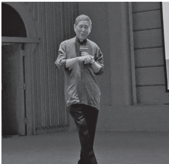
白先勇老師為讀者解述歷史故事（109年9月20日）

對談會結束後，白先勇教授為大批讀者簽書並與大家合影留念。大家彷彿上了一堂的中國現代軍事史和蔣桂關係史，令人難忘。（特藏文獻組杜立中）