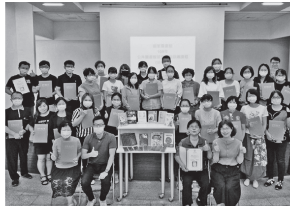
苗栗場次進階班學員開心結業合影（109年8月13日）