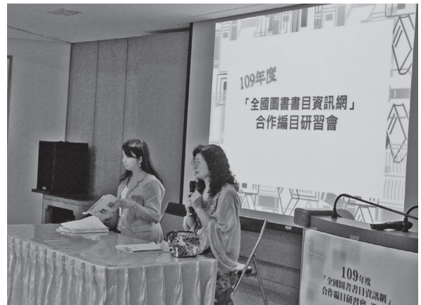
109年NBINet合作編目研習會講座與學員座談（109年9月17日）

劃具實用性，報名踴躍，參加的學員來自各類型合作單位，共計121人。為瞭解學員對研習課程的滿意度及需求，本次活動援例實施問卷調查，有效回收問卷102份。調查結果顯示，學員對本次研習會課程滿意度高達98.1%，並一致表示課程內容對其業務有幫助。本館日後將持續了解合作館需求，規劃合作編目研習課程的內容，以協助同道汲取合作編目相關之專業知能，進而提升NBINet聯合目錄整體品質。（書目資訊中心鄭惠珍）