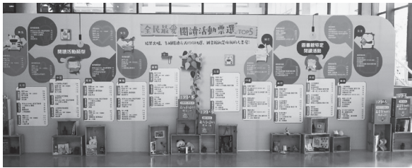
「全民最愛閱讀活動票選Top5」票選結果於本館藝文中心一樓展出（109年9月）