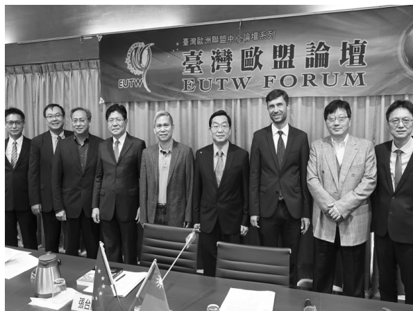
論壇主持人、發表人及與會來賓合影（109 年 10 月 23 日）

109 年度論壇議題緊扣歐洲各國政治情勢及防疫策略，匯集多場鞭辟入裡的精彩論述，促成各界學者專家集思廣益、共同研討的對談平臺，並引領與會民眾掌握歐盟及全球最新脈動。（知識服務組陳乃璋）