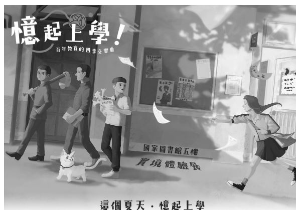
憶起上學互動展覽主視覺