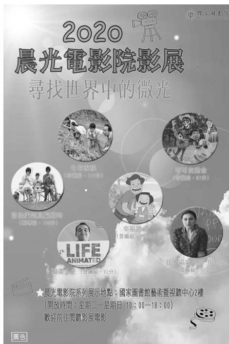
本館藝術暨視聽中心影展系列影片展示宣傳

透過本影展系列影片劇中之主人翁，在逆境中展現堅持、勇氣與投入的正面態度，恰可引領讀者在疫情影響下，藉由電影與相關資料的閱聽改變心境，以愛與熱情關照周遭人事物，驅除心中的黑暗與消極，亦盼疫情早日平息。（知識服務組邱昭閔）