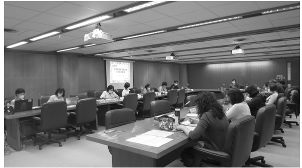
109 年 NBINet 決策委員會提案討論情形 (109 年 11 月 12 日)

上午舉行的決策委員會計 13 位委員及代表出席，與會人員針對提案交換意見討論熱烈，並表決通過衛生福利部國家中醫藥研究所、國立臺南大學、國立臺北教育大學、金門縣文化局等圖書館加入合作組織。下午舉行的合作館館長會議，共有館長及代表等 75 位出席。會中頒贈「金量」、「金心」、「金威」三個獎項，共有 37 館獲獎。此外也邀請到臺灣師範大學圖書資訊研究所曾元顯特聘教授主講「人工智慧在圖書館的未來應用」。本年度的決策委員會暨合作館館長會議就在通過相關議案後圓滿落幕。（書目資訊中心鄭惠珍）