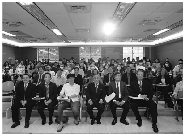
參加臺灣獎助金學人學術討論會暨成果發表之與會學者合影 (109年10月29日)

此次活動參與來賓高達八十餘位。除了多位外籍學人出席外，尚有「臺灣獎學金」於政大就學之青年學者參與討論，相關領域青年學子亦踴躍提問，場面熱烈。(漢學研究中心學術交流組吳億萱)