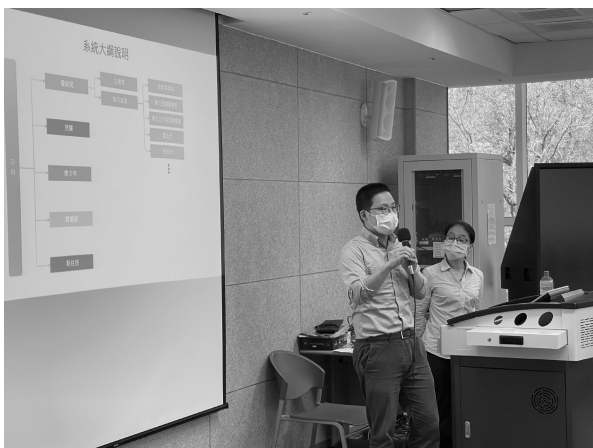
分齡分眾服務網教育訓練—國立公共資訊圖書館場（109 年 11 月 20 日）