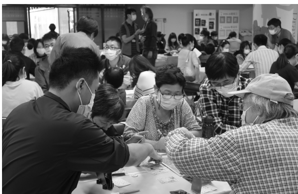
桌遊教學老師帶領民眾體驗桌遊（109年10月31日）