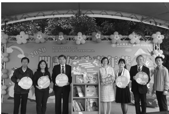
2020 閱讀好酷嘉年華啟動儀式 (109 年 10 月 24 日)

「憶起上學」互動展 扮演高中生穿越古今 / 109 年臺灣歐盟論壇，掌握歐盟新脈動