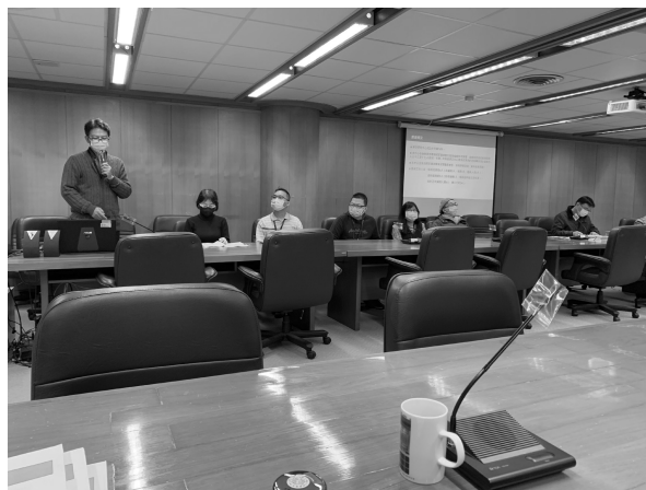
漢學研究中心於評鑑當日向委員進行簡報實況（109 年 12 月 16 日）

表現予以評定；另由委員依組室績效成果增頒「業務精進獎」。109 年度經過激烈競爭後，由圖書館事業發展組及知識服務組榮獲特優，以及其他 8 個組室榮獲相關獎項，安排於年終業務檢討會中公開表揚，並頒發獎狀及獎勵金，以嘉勉同仁過去一年辛勞，並持續為業務精進努力。（秘書室胡麗珠）