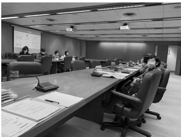
提案組室進行現場簡報與評審委員答詢情形 (109 年 12 月 10 日)

109 年共計 3 件提案：1 件創意提案、2 件創新行動。年度最佳創意提案第 1 名為發展組之「全國公共圖書館早期素養種子館員培育」，第 2 名為特藏組之「特藏文物分類健檢與建置文物修護資料庫系統」及館藏組之「創新設計『嬰幼兒圖書分齡主題表』」。(秘書室胡麗珠)