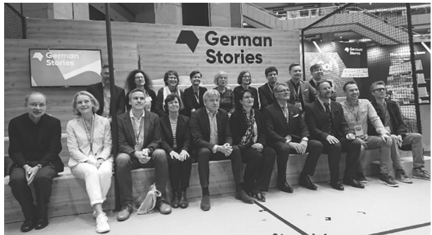
（右）圖 20 台北國際書展德國館舉辦作家對談