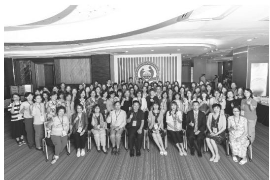
圖 16 第 41 屆醫學圖書館工作人員研討會大合照

學術海報競賽方面，先邀請學者專家從投稿摘要中評選出 10 幅海報參展，年會現場再由三位專業評審選出前三名，並由與會者票選出人氣獎。本年度的海報第一名為臺北醫學大學圖書館的「醫院圖書館聯盟服務滿意度調查：以臺北醫學大學數位圖書館聯盟為例」，而最佳人氣獎為成功大學醫學圖書分館的「Medical Reference Librarians as Research Partners of International Graduate Students in the Systematic Review Process: A Case Study of Kun-Yen Medical Library, NCKU」。（游立新）