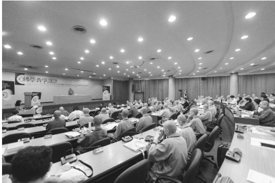
（左）圖 13 「佛學教學設計與資源運用研討會」會場一景

海報、照片、文宣品之外，還以現場解說方式介紹，供與會者經驗交流，為本次研討會增色不少。（釋自衍）