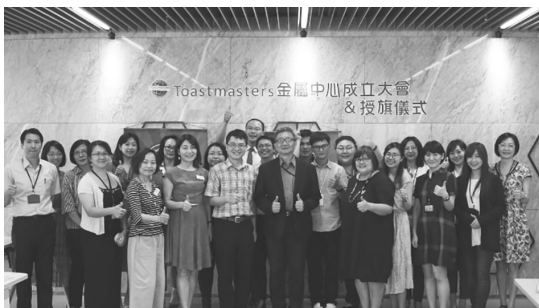
圖 21 舉辦 Toastmasters 成立大會與授旗儀式

完成 Toastmasters 成立大會與授旗儀式，由 Toastmasters 派代表致送分會會旗，並授予會員證書及幹部聘書。爾後固定在每月第二、四週的星期四舉行例會，期望長期能夠營造本中心英文演講表達及口說互動的氛圍。