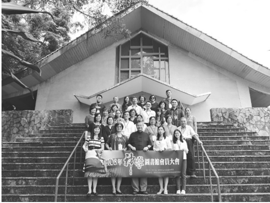
圖 12 「神學圖書館會員大會」合照