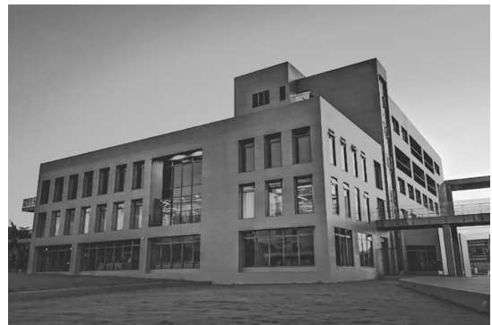
圖 15 中華福音神學院新圖書館外觀

設置密集書區、期刊區及一般書區等。9 月 23 日起試營運服務校內師生，10 月 1 日起正式啟用提供全面服務。（林荷鵠）