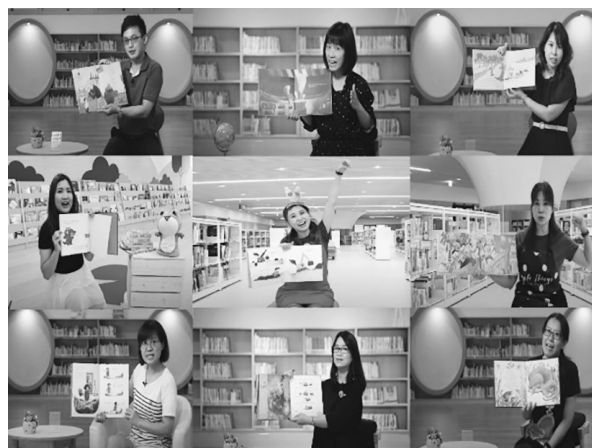
圖 10 臺南市立圖書館 線上說故事

「阿哲陪你帶小孩一線上故事屋」精選 70 本繪本，拍攝 70 部說故事影片，在市長黃偉哲臉書、文化中心及圖書館 FB 粉絲專頁及 YouTube 頻道等 10 個平台串連，民眾點開頻道就能聽故事閱讀，累積觀看人次高達 16 萬。