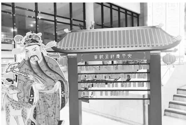
圖 2 本館新春祈願亭