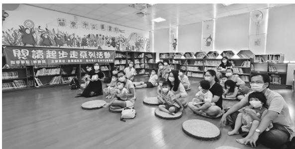
圖 8 苗栗縣公共圖書館閱讀起步走活動

及孩子導讀繪本，讓孩子透過閱讀迎向充滿無限想像的世界，也引領孩子享受閱讀趣，讓在愛與閱讀中成長的孩子，未來更能勇敢面對未知的挑戰與挫折。