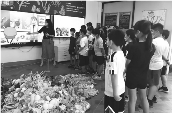
圖 11 臺東縣公共圖書館海洋環境教育

洋，臺東地理位置就在太平洋海岸線邊，此次特展，讓縣民驚覺原來在海洋裡，珊瑚礁就是海洋中的熱帶森林，有著生物界裡互利共生息息相關的事情，也加深縣民對於珊瑚保育的認識以及重視。