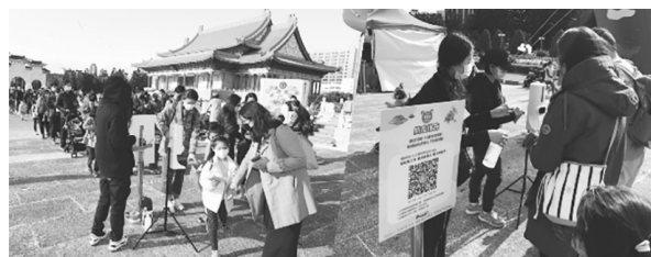
圖 4 本館 110 年臺灣閱讀節

讀品牌，由各類型圖書館、中央及地方政府機構、各級學校、出版社、文教機構及讀書會團體共同響應，推出多元豐富的閱讀活動，為每年令人引頸期盼的國家級閱讀盛會，也是各類型圖書館相互交流、學習精進的知識平臺。2021 年活動時值臺灣疫情警戒由三級降至二級，逐步放寬管制的狀態，這場閱讀盛宴猶如一場心靈饗宴及情緒出口，為了讓民眾安心參加，活動前加強宣導各項防疫措施，活動當天豔陽高照，民眾展現高度公民素質耐心排隊配合各項防疫措施，安心投入豐富多元的攤位活動，吸引逾 8 萬人次民眾熱情參與，熱鬧滾滾人潮不斷，大小朋友均樂在其中，流連忘返。