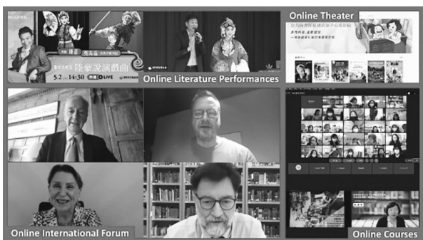
圖 3 本館各類型線上活動

本館在疫情嚴峻期間服務不停歇，翻轉圖書館服務，善盡圖書館的社會責任與角色。在圖書館館員專業知能培育上，推動線上國際論壇與線上教育訓練課程，邀請國際知名圖書館館長擔任講座，拓展圖書館同道見聞，也辦理各種館員專業知能培育課程，帶領圖書館同道成為與時俱進的專業人才。在全民閱讀風氣推動上，推出線上文學表演與線上電影院等多項服務，讓民眾在疫情期間，透過線上欣賞文學演出與電影作品，舒緩緊張情緒，是支持全民自主與終身學習，以及陪伴民眾度過防疫時期最堅強的後盾。