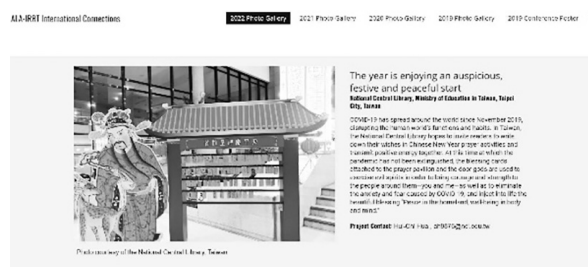
圖 1 2022 Best Practices from World Libraries Photo Gallery