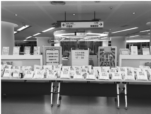
圖 6 新北市立圖書館兒童閱讀包

在新冠肺炎疫情大流行下，公共圖書館面臨關閉閱覽空間的挑戰，這張照片描述著新北市立圖書館在疫情封鎖下，館方提供「盲借」創意服務「閱讀便利包」，每份閱讀包就像是神秘的圖書館版福袋一般，等待著無法進入兒童故事屋的小讀者來驚喜開箱，這樣的服務措施提供家長在疫情期間，滿足學童因學校關閉無法學習的困境，也因此找回親子共讀的時光。空蕩蕩無人的圖書館空間，在緊張的疫情當下，用「閱讀便利包」滿足每個小朋友遨遊書海、持續閱讀的美好。