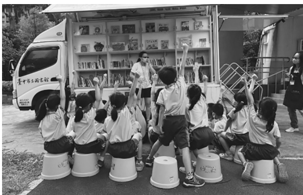
圖 9 臺中市立圖書館行動書車

臺中市立圖書館主動深入社區、公共空間，跨域與廟埕、市場、景點、公園、醫院、大學等多元據點合作推廣閱讀，根據據點需求量身選書，縮短圖書館與民眾距離。疫情期間結合館員精選書、親和力十足的服務、繪本說故事活動傳遞閱讀的美好，培養學童閱讀好感度，用閱讀療癒孩童因疫情蔓延產生的不安；用公私協力的閱讀服務，實現「整座城市都是我的大書房！」理念。