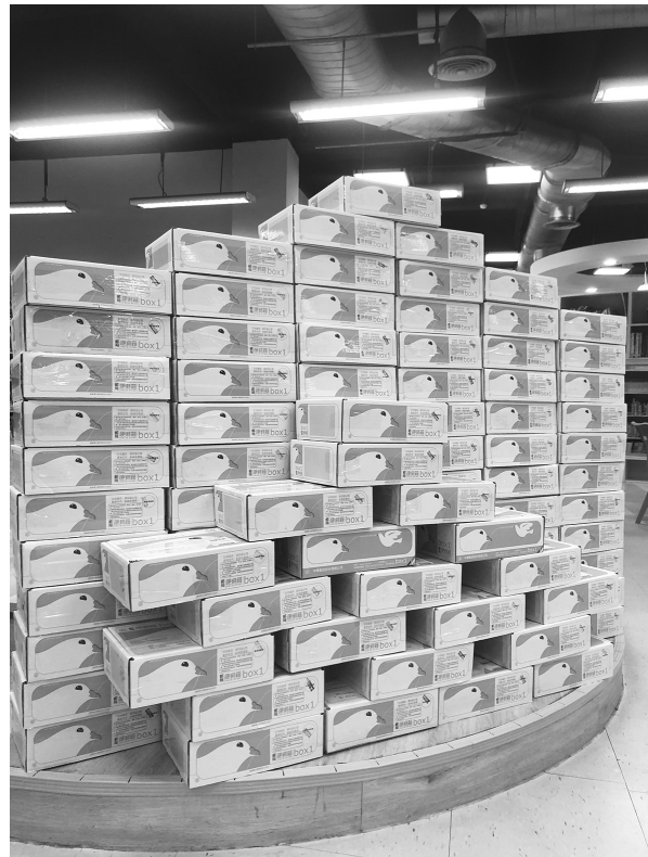
圖 7 新竹縣公共圖書館防疫書箱

通」服務，由館員根據愛書人的需求，精選 100 箱各類優質好書，免費宅配送到讀者家，讓讀者不必出門，也能夠在家閱讀好書，降低接觸感染風險的同時，還能持續提供讀者閱讀服務，也期望在抗疫的路上，圖書館推出的各項活動，能提供大家小小的心靈雞湯，用書香撫慰焦躁不安的心。