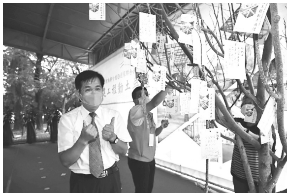
教育部潘文忠部長掛上祈福卡，說讚。（111年9月5日）