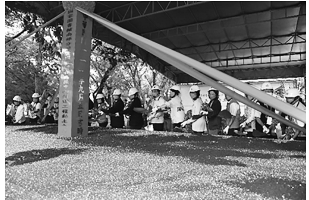
「國家圖書館南部分館暨國家聯合典藏中心」新建工程動土（111年9月5日）

黃偉哲市長、曾淑賢館長、施工廠商、設計監造單位、專案管理單位，以及各界貴賓、各級長官、民意代表和在地里長，焚香祝禱祈求工程順利圓滿成功後，共同執鏟動土宣布正式開工。