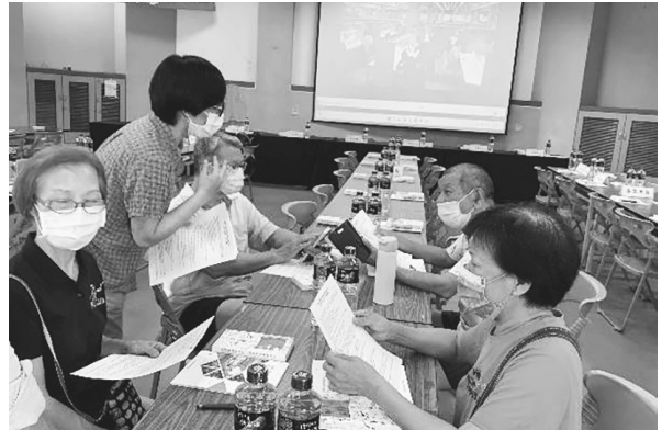
充滿服務熱忱的鄉親們加入國圖南館暨聯典中心志工團隊（111 年 8 月 23 日）

本工程的推動與執行，以及介紹未來南部分館與國家聯合典藏中心服務特色，也獲得在場鄉親一致支持，當天晚上即招募到 5 位鄉親加入志工團隊。