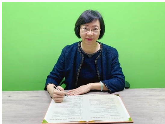
國家圖書館館長曾淑賢博士簽署設立於英國聖安德魯斯大學之「臺灣漢學資源中心」合作協議

術、音樂、電影、媒體等議題，兼顧中華文化的深度及廣度。研究的範圍為廣義的華語地區，除了亞洲使用華語的國家，也廣及世界五大洲的各海外移民國家。與臺灣最密切相關的是，其華語教學係以繁體中文教學為主。