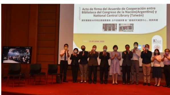
阿根廷現場學界、政界、僑界、館員等齊聚一堂見證台阿學術合作的歷史時刻。儀式完成，國家圖書館同仁與貴賓向阿根廷現場來賓(左側螢幕)拍手致意