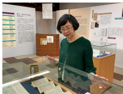
國家圖書館曾館長 觀賞特藏文獻主題展