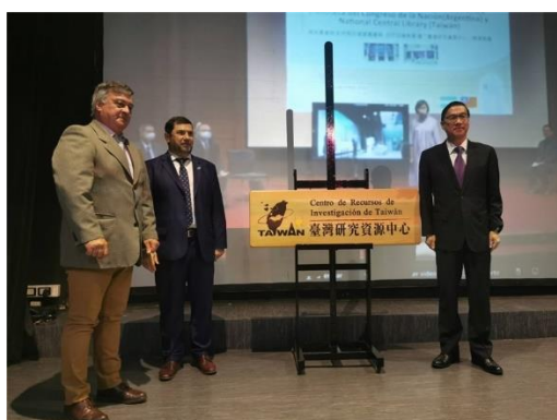
揭牌儀式完成