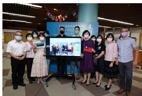
雙方與會長官以及嘉賓合影留念