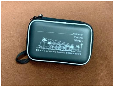
硬殼防疫小物收納包

為有效宣傳暨推廣本館遠距學園平臺，除積極辦理與運用各式媒體進行推廣行銷外，更開發專屬文創商品，如有：「硬殼防疫小物收納包」、「質感文青春捲包」等，配合各項推廣活動發送，除可提升推廣活動參與之人次及學員參與意願，更有效植入於日常生活常用物品，加深品牌可見度及拓展其觸及度，進而提升活動推廣效益。