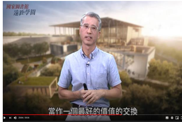
「服務管理及服務創新」課程