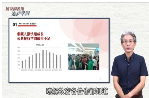
「圖書館策展新視野」課程