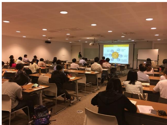
919 愛學習嘉年華_本館設攤推廣遠距學園 7月24日於高雄市立圖書館辦理推廣活動