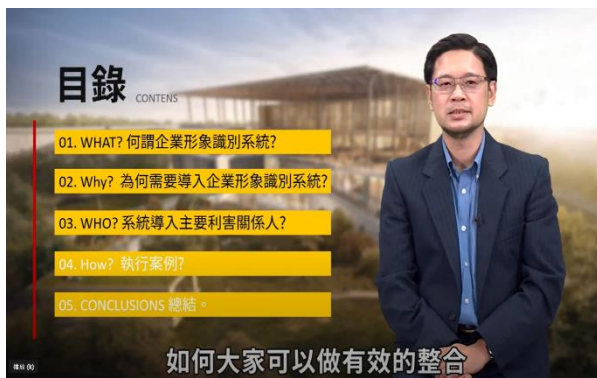
「圖書館導入企業形象識別系統」課程