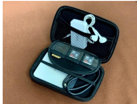
硬殼防疫小物收納包