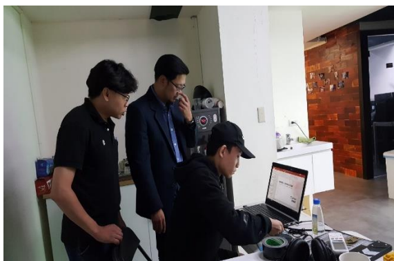
張國賓老師與導演導論簡報腳本