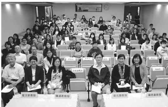
圖 61 CALISE 109 年舉辦「圖書資訊學研究回顧與前瞻研討會」合影