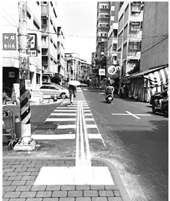
圖 7 新北市中和區中和路 400 巷無障礙交通動線改善成果