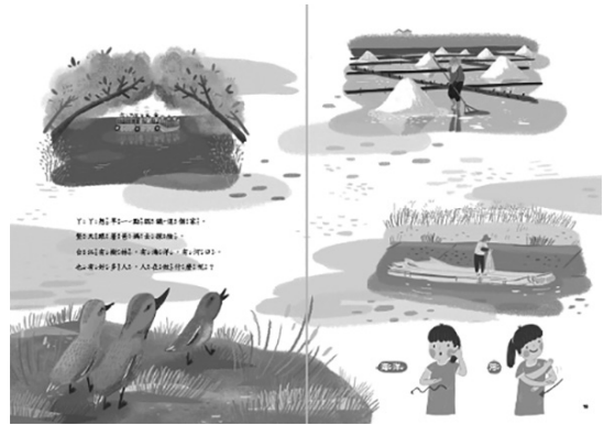
圖 2 《小水鴨，兩個家》臺灣手語版繪本內頁手語插圖

(2) 為滿足全盲及低視能兒童共讀需求，於 109 年首創「繪本口述影像有聲書」，以口述影像方式呈現繪本中無文字描述的部分，搭配專業、生動的說故事技巧，選錄