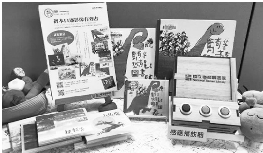
圖 3 客製化感應播放器及繪本口述影像有聲書套組

主題包含本土、環境及生命教育等。109 年度共製作 10 種繪本口述影像有聲書，每種皆附「親子共讀指南」，支持視障家長陪伴共讀，並可同時搭配雙視圖書（點字）、客製化感應播放器及觸摸輔具等進行使用；有聲檔亦存置於國臺圖系統，供家長、教師及兒童在不同情境、階段及學習歷程下，皆能輕鬆利用，體驗共讀樂趣。