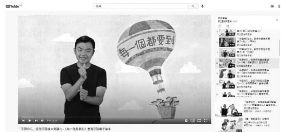
圖 1 國臺圖 YouTube 官方頻道手語專區「臺灣手語電子繪本」

等加值資源，提供更多元閱讀形式及教學應用；另特別徵求內政部營建署及國家台江公園管理處合作授權，編印《好想要回家》、《小水鴨，兩個家》臺灣手語版繪本共 2,000 冊，後續寄送公共圖書館典藏及推廣活動使用。