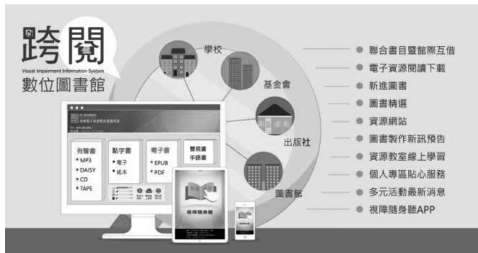
圖 4 國臺圖視障電子資源整合查詢系統功能架構圖

本系統於 107 年 6 月取得新版無障礙網頁開發規範 2.0 版的 AAA 檢測等級；108 年改版為「自適應網頁」，能依載具畫面大小呈現最適合的配置；109 年新增「輔具介紹」及優化「聯絡我們」功能，將持續依據讀者反映意見，滾動改善系統及「視障隨身聽 App」服務，持續提升易用性及便利性，以貼近身心障礙者的閱讀需求。