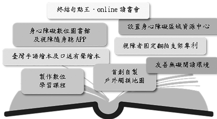
圖 9 實踐閱讀平權創造友善環境