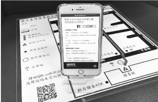
圖 5 觸摸式地圖可搭配路線導引定向解說網頁使用

測試。本項服務於 109 年 6 月初開放使用，另提供觸摸式地圖使用說明及往返圖書館定向解說網頁、錄音檔，供視覺障礙者搭配使用。