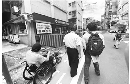
圖 6 新北市中和區中和路 400 巷改善前路況

目型格柵等設施改善，本館於上述工程定位後接續施作館前門廣場至大門之無障礙動線，將可增進視障者自主往返圖書館及捷運站的安全性與便利性，進而提升視障讀者到館使用率。