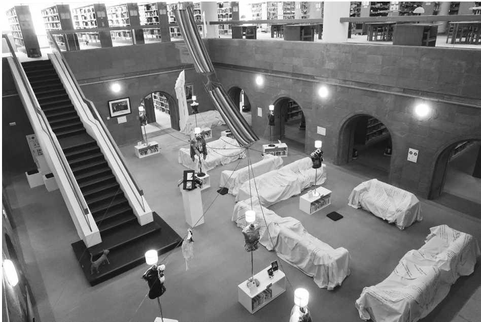
圖 2 2021 一冊一世界 VI 馬奎斯《百年孤寂》展場