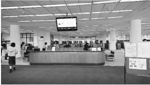
圖 6 過去的 1 樓館舍