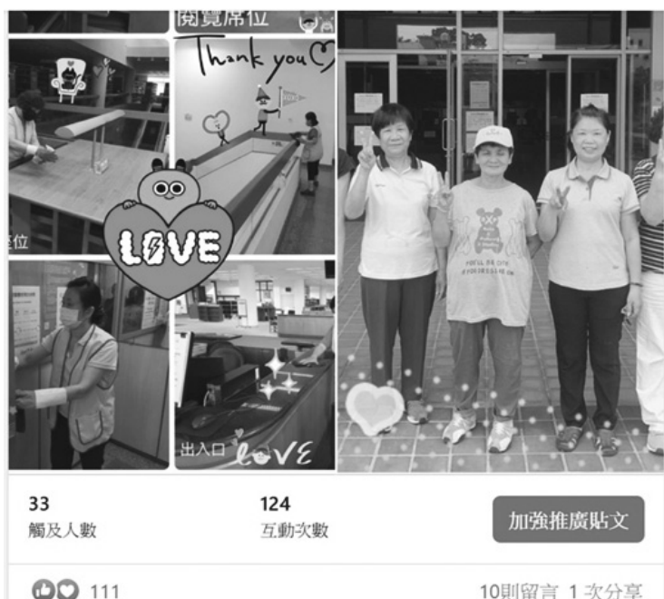
圖 4 成圖小故事介紹清潔阿姨們的工作，獲得 10 則讀者鼓勵留言，迴響熱烈