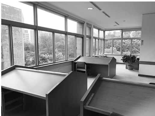
圖 8 過去的 3 樓館舍

有了一樓使用者意見空間改造經驗後，2021 年更回應讀者需求，歷經多次規劃討論會議，蒐集國內外大學圖書館空間規劃經驗，並與學生會意見交流後，於總圖三樓東北側新增「祈禱與靜心區」。此區改造自逐漸淡出讀者需求的閱報區，位於兩面臨窗的溫暖角落而擁有滿滿的自然採光，以拉簾隔開一般讀者區，木造地板、柔和光線立燈與原木家具的選用，營造出舒適、溫馨且放鬆的場域氛圍，打造多元信仰及沉靜心靈的新空間；同時設置可彈性調整空間的活動屏風，準備各式地墊與坐墊、祈禱墊等物品，邀請不同文化背景與追尋靜心的讀者，到此沉澱心靈（圖 8、9）。