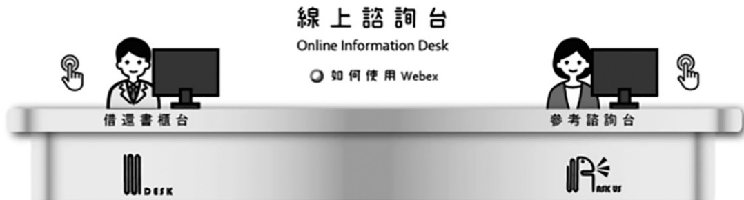
圖 10 成大圖書館線上諮詢台

本館閉館之初將 I Desk（讀者閱覽服務）、Ask Us（參考諮詢服務）與 Webex 結合，讓讀者在無法進館期間，仍能透過熟悉操作的媒介享受圖書館線上服務，線上諮詢台（Online Information Desk）因此誕生（圖 10）。透過 Webex 會議軟體與館員即時通話，並搭配畫面共用功能即時顯示問題，有效且即時地獲得解答；當諮詢讀者同時間超過 1 人時，館員可利用「分組討論」功能引導至個別會議室諮詢，互相不致干擾。當圖書館啟用此項服務後，校方更將其概念應用到全校各單位，於居家辦公時也能順利進行公務聯繫。即便現在已是後疫情時代，因應疫情改變了讀者使用圖書館的行為，本館仍持續提供 Ask Us 的 Webex 虛擬櫃台服務。