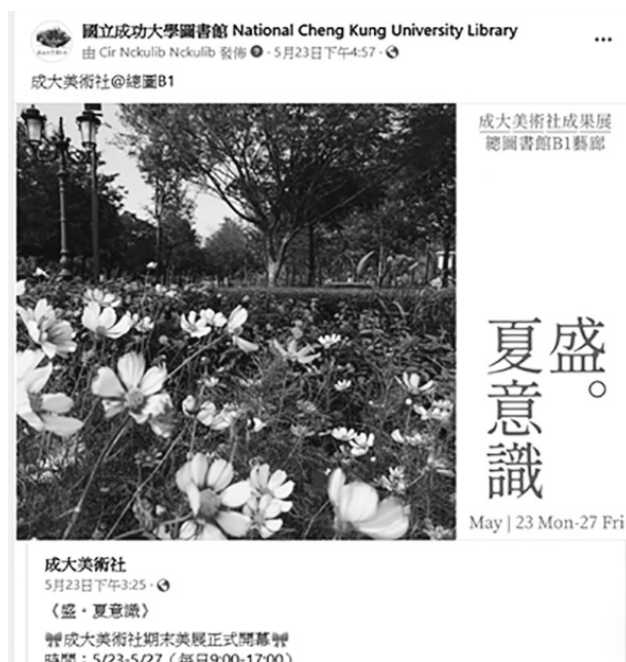
圖 5 連接在地機構：學生社團