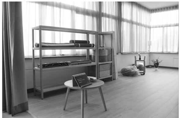
圖 9 成大總圖 3 樓「祈禱與靜心區」