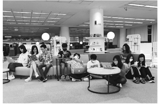
圖 7 成大總圖 1 樓新空間