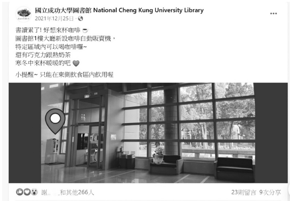
圖 3 本館代言人小鸚鵡以讀者角色宣傳輕食區咖啡機獲得本館粉絲頁最高按讚數

隨著 FB、IG 的普及化，本館的社群行銷也從館方角度改變考量以契合讀者喜好，過去多以公告式所發布的訊息，現改從讀者角度與溫情互動中出發，誕生了「成圖小故事」與本館的代言人小鸚鵡。小鸚鵡在社群媒體中作為讀者角色（圖 3），分享了許多圖書館與工作人員們背後的用心（圖 4），並連結校內學生社團與在地機構（圖 5）；除發文外，也因應時下串流媒體興盛，不定期拍攝並推出影片，獲得許多讀者按讚肯定、留言、分享甚至私訊迴響！