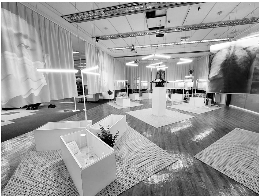
圖 1 2020 一冊一世界 V 卡繆《瘟疫》展場

內在（自我）與外在（世界）之間的聯繫與解離、卡繆《瘟疫》 12 書中四個階段心境轉折與疫情時事連結、馬奎斯《百年孤寂》 13 書中情節及來自拉丁美洲年輕學子的鄉愁等，並蒐羅相關領域圖書展出與推薦延伸閱讀（圖 1、2）。在書展期間，更邀請與展出主題相關專家學者赴館舉辦專題演講，讓經典透過各種再詮釋、互文來活化，加以形塑本館的特色學術形象，同時透過另一種展覽面貌，帶領讀者走進重要經典作品的世界。