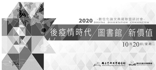
圖 55 2020 數位化論文典藏聯盟研討會主視覺

館館長 Louise Jones 視訊與會（如圖 56），以「You need to unmute yourself- Library life during COVID-19」為題，探討圖書館作為成長有機體變化和轉型的本質，並分享圖書館專業人員在新冠肺炎期間制訂的戰略規劃，防止疫情反撲。本次研討會分享國內外學者專家之學術研究成果及實務經驗，共同學習疫情期間各館的應對措施與創新之舉。共有來自全國大專校院及公共圖書館，120 位會員館代表及同道參與。