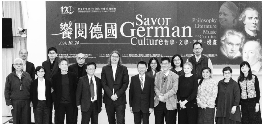
圖 57 參與「饗閱德國」活動之貴賓合影留念