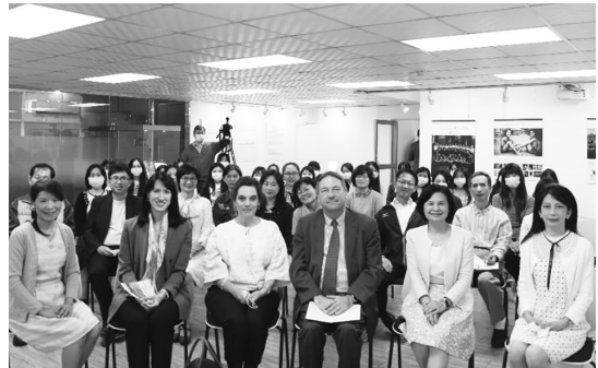
圖 59 「SHOAH—猶太大屠殺」展覽開幕式貴賓與康寧大學師生合影