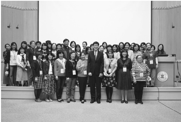
圖 54 「北醫六十·邁向榮耀：圖書館聯盟與合作研討會」全體與會者合影

臺灣醫學圖書館學會與 EAHIL 理事主席 Maurella Della Seta 雙方學會締約姊妹組織後，持續分享組織計畫及資訊交流。109 年因 COVID-19 全球疫情關係，重要國際會議改為線上會議。理事長邱子恒率領該學會與中華民國圖書館學會醫學圖書館委員會成員參與 8 月 10-14 日美國醫學圖書館學會 2020 年會 (MLA' 20)，並發表 4 篇海報。又於 11 月 16-18 日參與在波蘭羅茲舉行的第 17 屆歐洲健康資訊暨圖書館學會年會 (European Association for Health Information and Libraries, EAHIL) 線上會議。