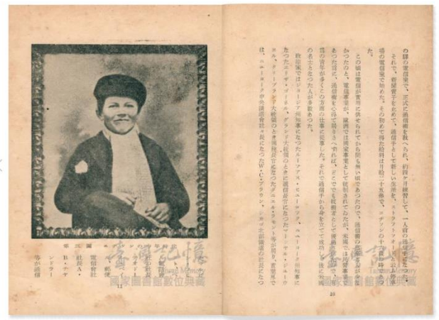
掃描影像檔瀏覽畫面