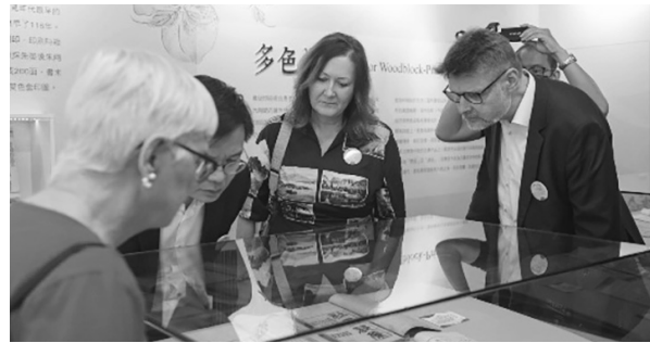
外國國家圖書館貴賓們參與導覽仔細欣賞展品 (112 年 4 月 19 日)

特展開幕典禮結束後，由知服組及特藏組分別進行英文、中文專業導覽，國外貴賓特別於留言區寫下對國圖的祝福，知識瑰寶特展開幕活動在貴賓進行體驗活動後圓滿結束，國圖 90 館慶系列活動自此正式啟動。