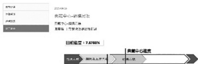
國家圖書館南部分館暨聯合典藏中心新建工程資訊網 (112 年 5 月 10 日)