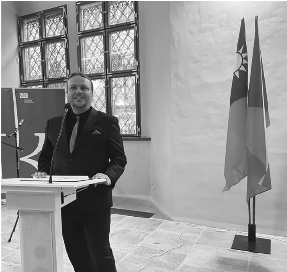
捷克共和國文化部副部長 Ondřej Chrast 致詞