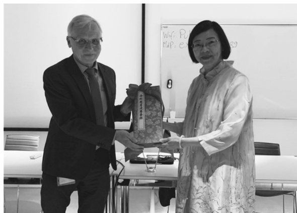
國圖致贈法蘭西學院國寶等級復刻書《金剛般若波羅蜜經》

為表達對於本次揭牌活動的重視與祝福,國家圖書館特以兩部館藏國寶級古籍復刻書致贈該校,包括宋嘉定六年(1213)淮東倉司刊印的《註東坡先生詩》,以及元至正元年(1341)中興路資福寺刊本《金剛般若波羅蜜經》。藉由經典的交流,除豐富法蘭西學院圖書館的館藏,並見證兩館合作歷史性的一刻,為未來合作開啟契機。