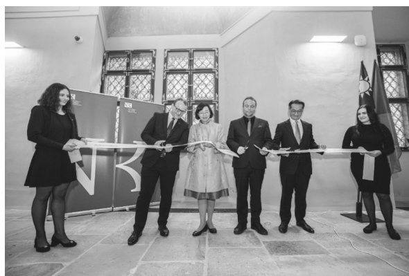
雙方代表共同為展覽剪綵開幕