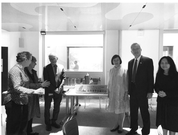
法蘭西學院「臺灣漢學資源中心」揭牌啟用儀式