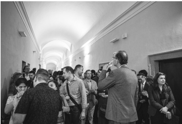
捷克各界代表出席開幕典禮