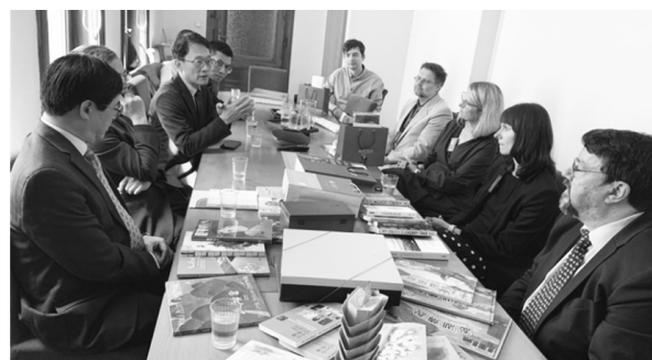
布拉格市立圖書館與國家圖書館兩館人員進行座談交流