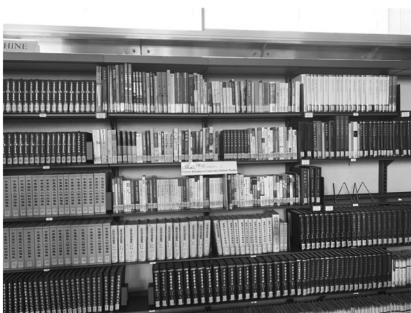
法蘭西學院臺灣漢學資源中心一隅