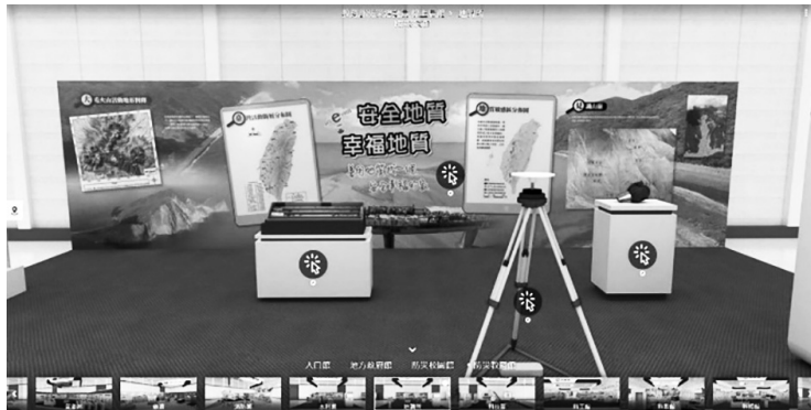
圖 40 經濟部中央地質調查所圖書館 110 年協辦教育部防災總動員—防災校園大會師線上展覽