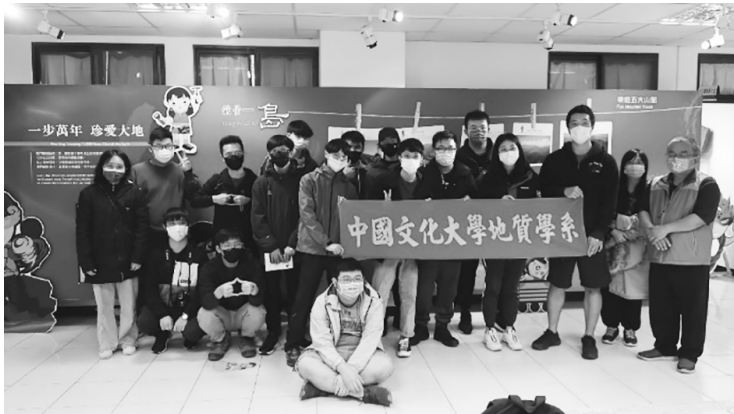
圖 39 文化大學地質系師生參訪經濟部中央地質調查所地質多媒體展示場

(8) 獎勵地質推廣教育：於 110 年 3 月舉行《地質》期刊 109 年度優良文章評選，擇特優 1 名、優等 3 名，並於 110 年 11 月 22 日中華民國地質學會年會暨會員大會頒獎。