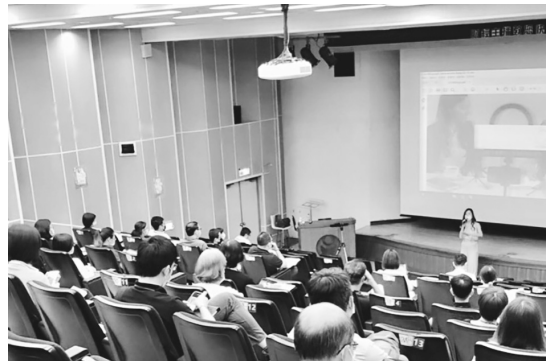
圖37 金屬中心圖書館舉辦「Podcast三部曲」說書系列活動

在實作競賽的部分，則由同仁將自己的研究領域、自身專長或工作內容透過錄製Podcast呈現，或將讀書心得錄製成Podcast參加競賽，票選前三名獲得獎金，成為中心播客王！