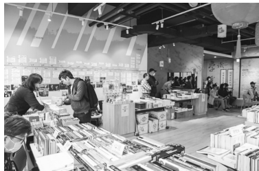
圖 33 中華福音神學研究學院圖書館配合閱讀 Book Show 書展舉辦小型演講