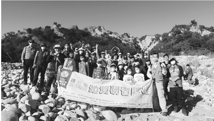
圖 41 經濟部中央地質調查所圖書館 110 年辦理地質研習課程及戶外賞析配合綠色生活政策，推動創意地質旅遊

地質資料、知識與資訊，隨著地質調查研究工作的推進，逐漸累積並講求實務應用。綜上經濟部中央地質調查所圖書資訊服務，110 年度服務地區涵蓋臺北市、新北市、桃園市、新竹縣、苗栗縣、臺中市、彰化縣、臺南市、連江縣等 9 個縣市，總計 58 場次各類服務，從實體及網路平臺觸及 200 萬以上人次，捲動更多人關心地質知識，為我國提升地質環境教育與保育工作之效益。（郭麗秋）