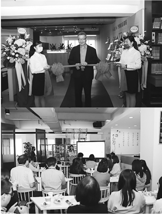
圖 38 金屬中心圖書館「新天地開幕儀式 & 喜迎 +0 深度旅遊書展」活動