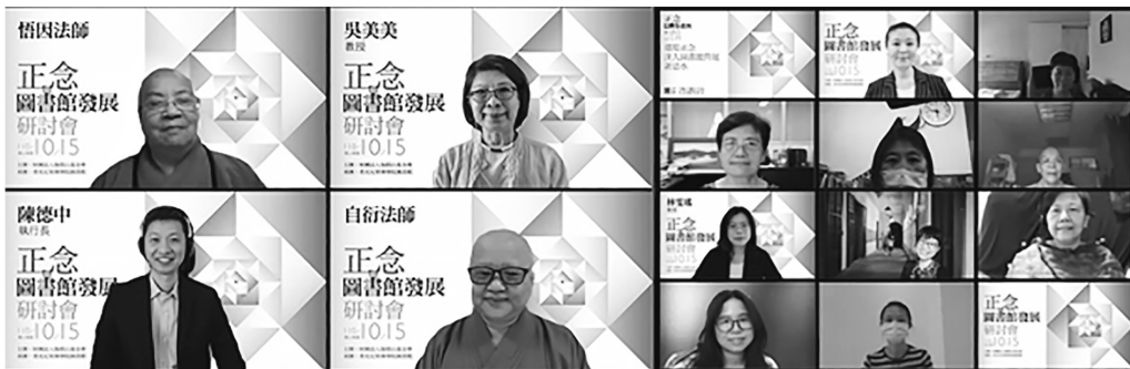
圖 30 香光尼眾佛學院圖書館舉辦「正念與圖書館發展研討會」

因此，財團法人伽耶山基金會特別於 110 年 10 月 15 日舉行「正念與圖書館發展研討會」，規畫認識正念，正念與領導力、情緒管理，正念與圖書館發展之關係，正念運用在圖書館管理，四個議題。由於酌量疫情的情況，故採用 Webex 線上會議方式進行（圖 30）。