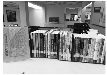
圖 34 基督教台灣浸會神學院圖書資訊中心主題書展—公共神學與公民素養