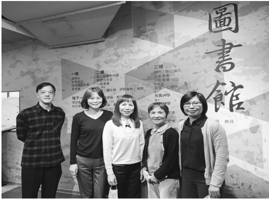
圖 31 神學圖書館委員會主任委員至中華福音神學研究學院暨圖書館參訪合影